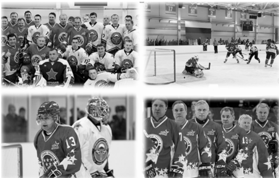
Рисунок 3. Матч между командами "Легенды хоккея СССР" и командой ВДВ.

Так, например, Министр обороны РФ генерал армии С.К. Шойгу, завершая посещение Рязанского высшего воздушно-десантного командного училища имени генерала армии В.Ф. Маргелова, лично принял участие в хоккейном матче между командами "Легенды хоккея СССР" и командой ВДВ. В этом матче приняли участие и кур-