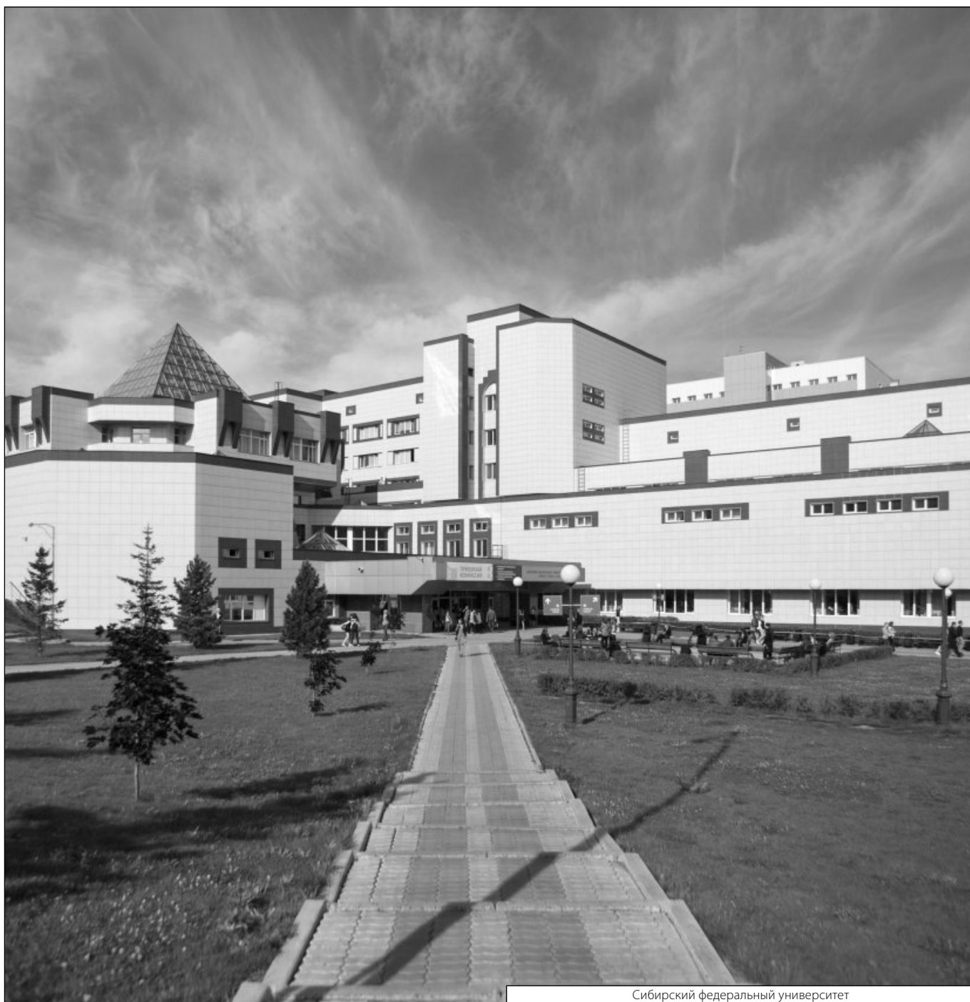
Сибирский федеральный университет

Журнал «Современная наука: актуальные проблемы теории и практики»