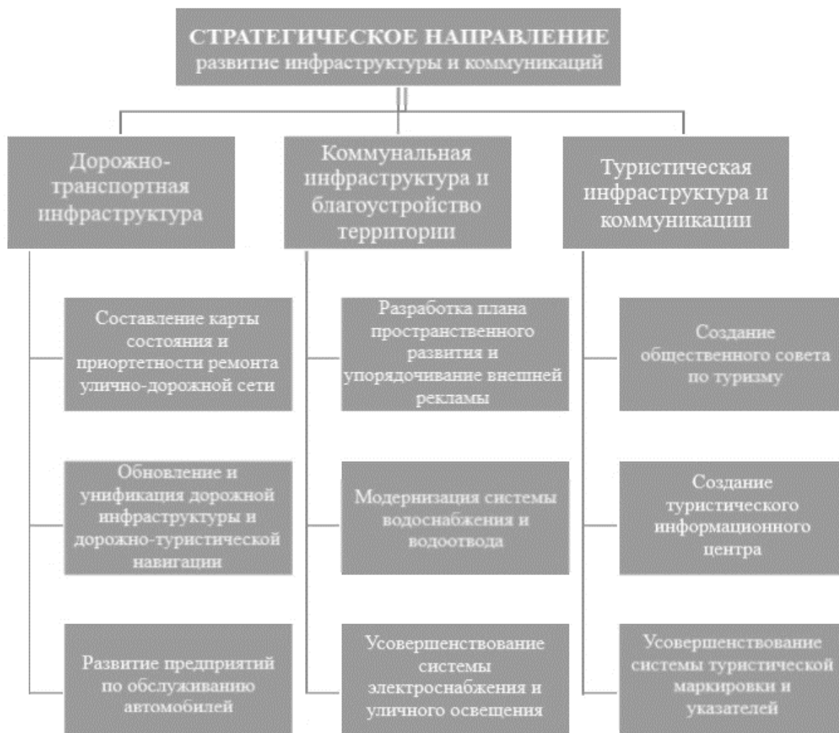
Рис. 2. Стратегические направления развития инфраструктуры и коммуникаций в Республике Саха (Якутия)