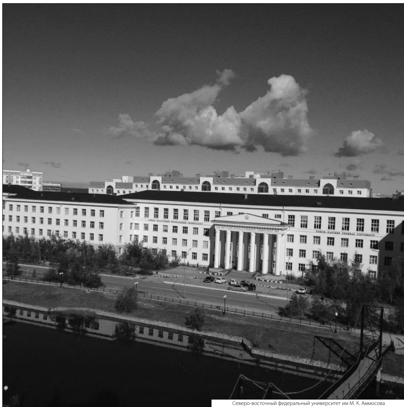
Северо-восточный федеральный университет им М. К. Аммосова

Журнал «Современная наука: актуальные проблемы теории и практики»