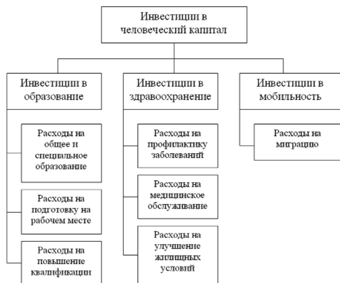
Рис. 2. Структура инвестиций в человеческий капитал (составлено автором)

Еще в 70-е годы Н.Н. Некрасов отмечал, что материальное стимулирование является лишь одним из направ-