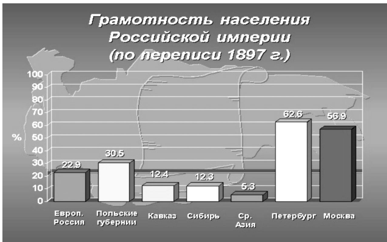
Рисунок 1. Уровень грамотности в России (конец XIX в.).

Кроме того, ситуация усугубляется имманентным противоречием, присущим любой образовательной системе: будучи одним из самых консервативных социальных институтов, образование при этом выступает базисом для формирования будущих поколений.