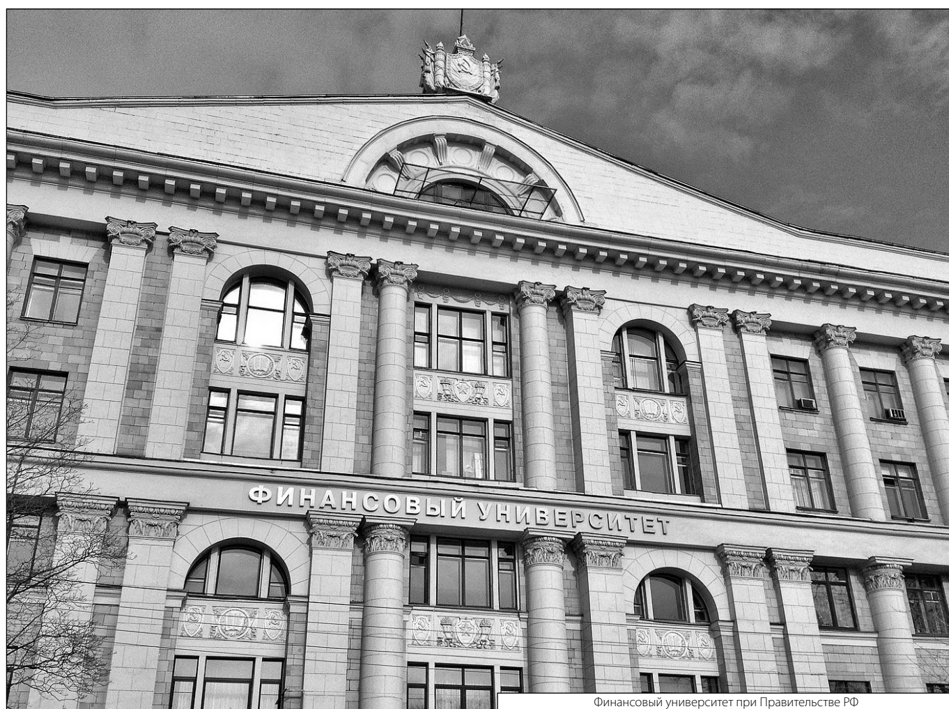
Финансовый университет при Правительстве РФ

Журнал «Современная наука: актуальные проблемы теории и практики»