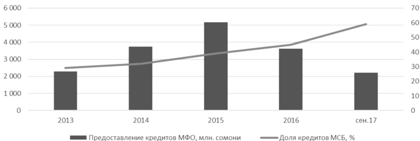
Рисунок 2. Динамика количества кредитов МФО и доли в них кредитов малого бизнеса [4, 13].