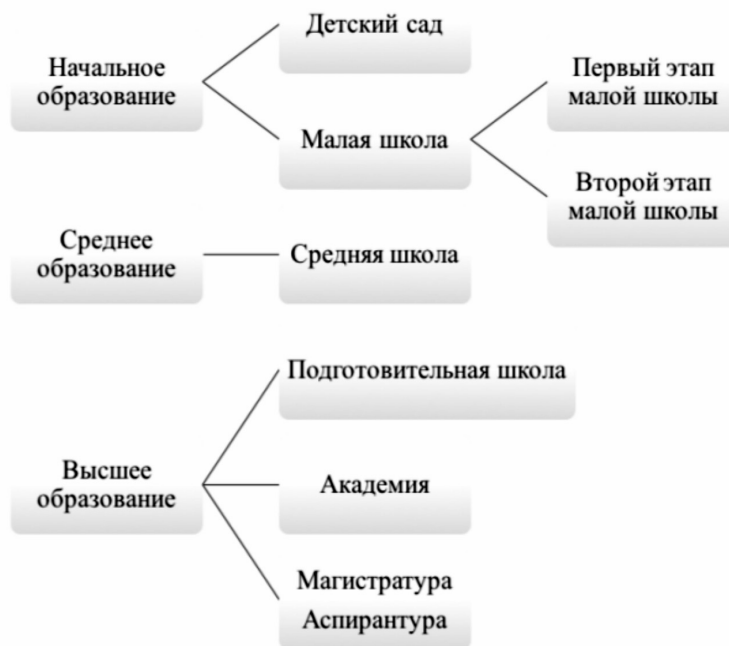
Схема 1. Новый стандарт системы образования

культет русского языка и литературы был наиболее значимым для университета. Там преподавало много русистов, обучавшихся в СССР. Студенты должны были прежде всего уметь общаться на русском языке и говорить на темы, связанные с политической Советского Союза. К сожалению, в настоящее время в Шанхайском университете уже не существует факультета "Русский язык и литература".