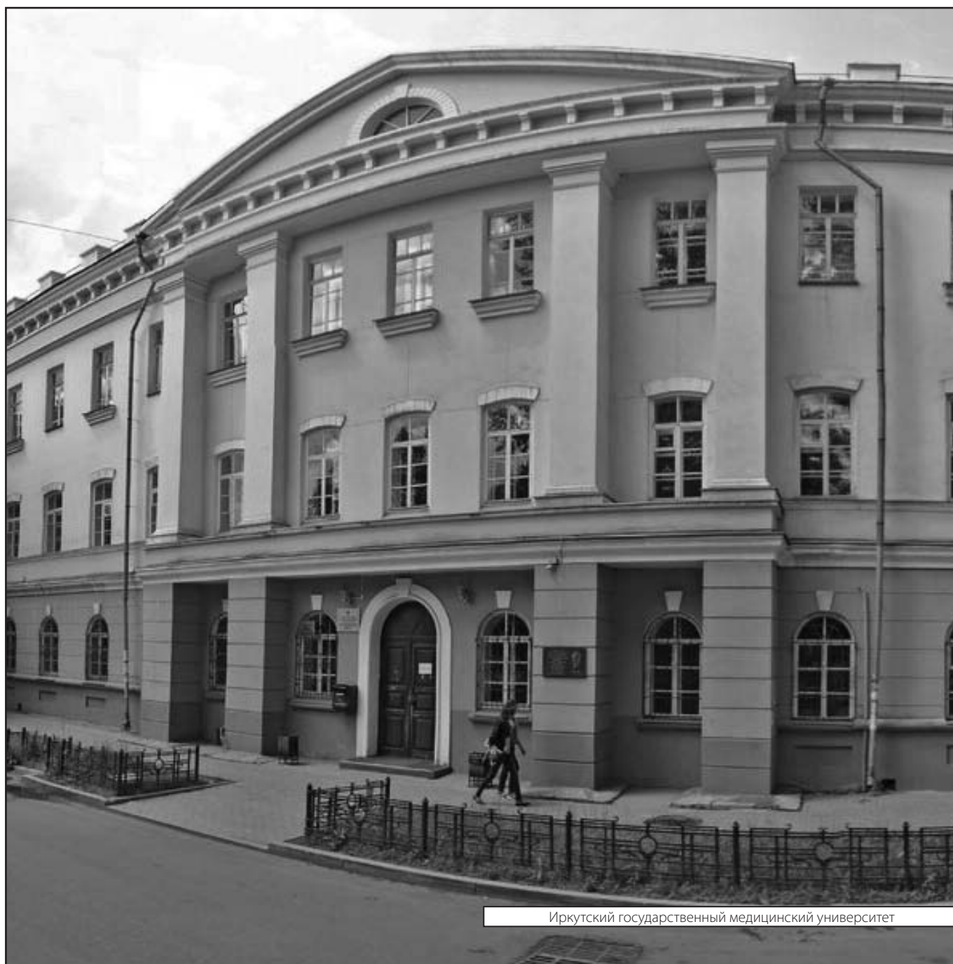
Иркутский государственный медицинский университет

Журнал «Современная наука: актуальные проблемы теории и практики»