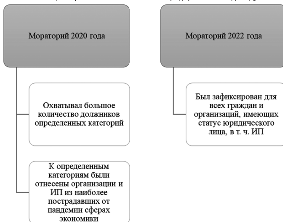
Рис. 2. Различия между старым и новым мораторием

тексте речь идет о просрочке, превышающей 6 месяцев. В такой ситуации кредиторы имели полное право подавать заявление об их банкротстве.