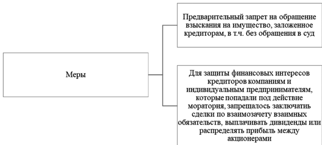
Рис. 1. Меры дополнительной защиты финансового положения предприятий и индивидуальных предпринимателей