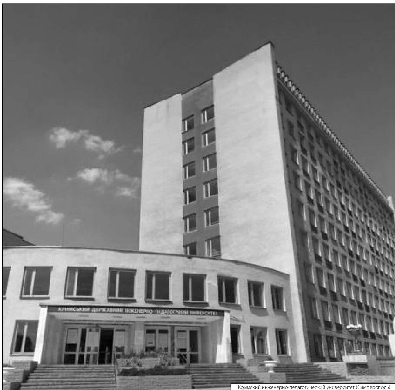
Крымский инженерно-педагогический университет (Симферополь)

Журнал «Современная наука: актуальные проблемы теории и практики»