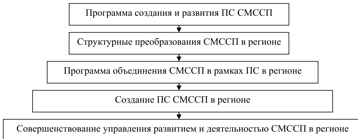
Рис. 1. Блок-схема последовательности действий по реализации программы создания и развития ПС СМССП

щественно горизонтальные связи и механизмы специализации и взаимодополнения, они получают дополнительные возможности к достижению более высоких результатов.