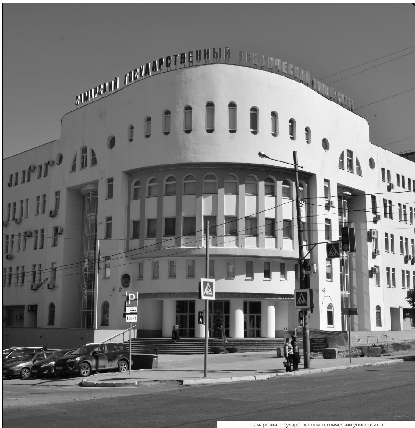
Самарский государственный технический университет

Журнал «Современная наука: актуальные проблемы теории и практики»