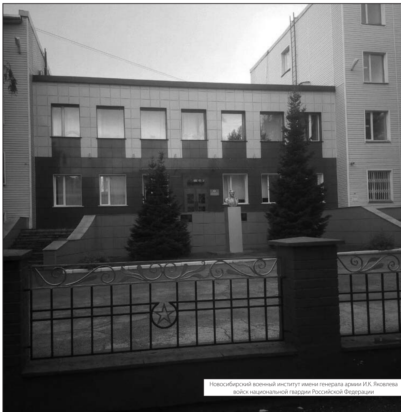
Новосибирский военный институт имени генерала армии И.К. Яковлева войск национальной гвардии Российской Федерации

Журнал «Современная наука: актуальные проблемы теории и практики»