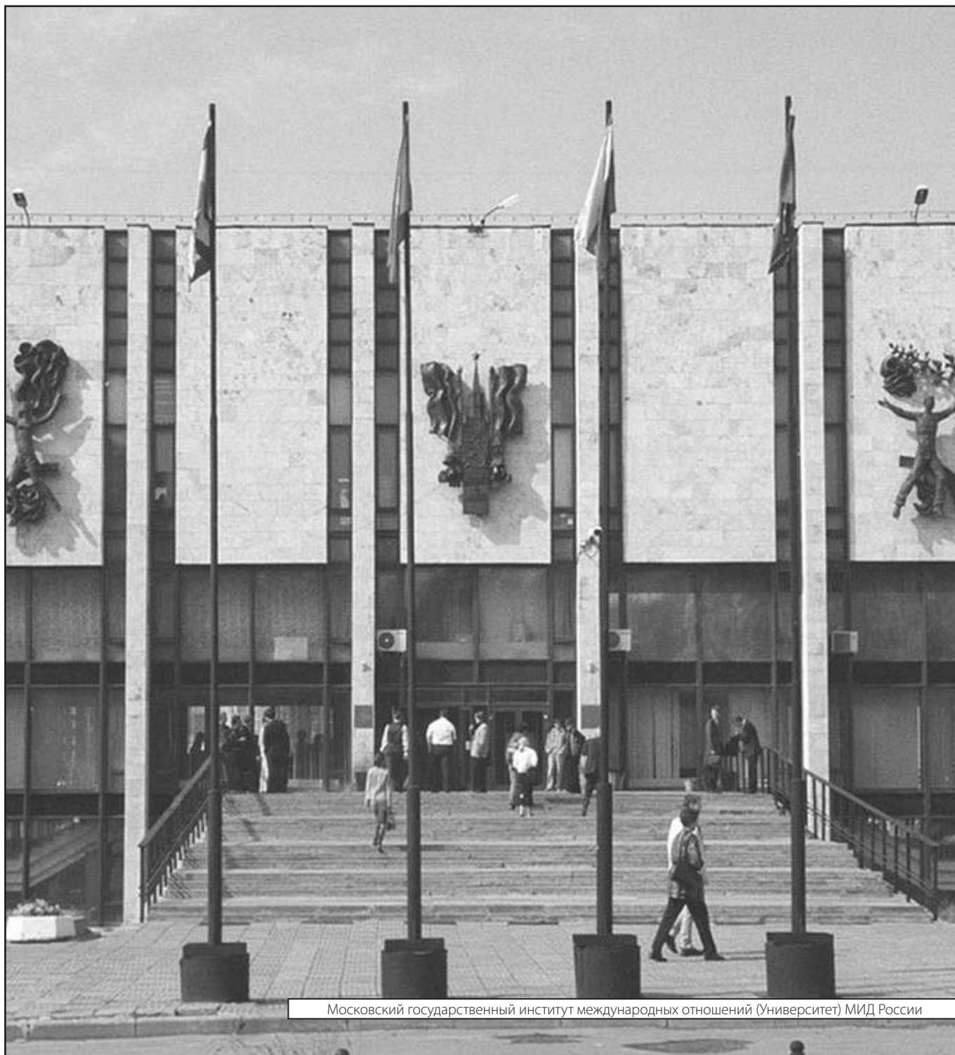
Московский государственный институт международных отношений (Университет) МИД России

Журнал «Современная наука: актуальные проблемы теории и практики»