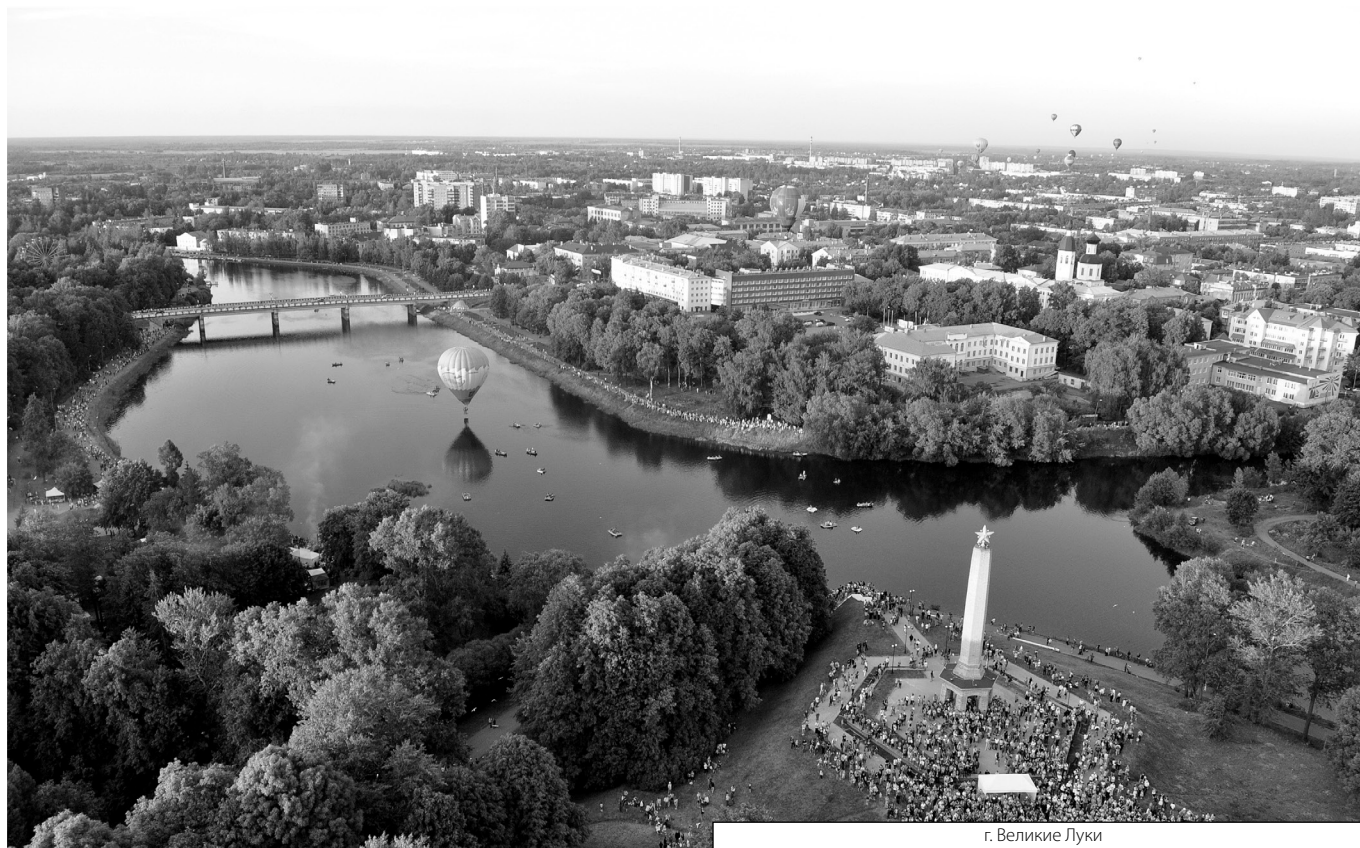
г. Великие Луки

Журнал «Современная наука: актуальные проблемы теории и практики»