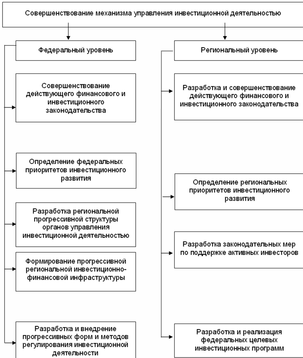
Рисунок 1. Основные направления инновационного развития инвестиционной деятельности в регионе.

Государственное регулирование инвестиционной деятельности должно предусматривать создание благоприятных условий для развития инвестиционной деятельности, осуществляемой в форме капитальных вложений, путем: