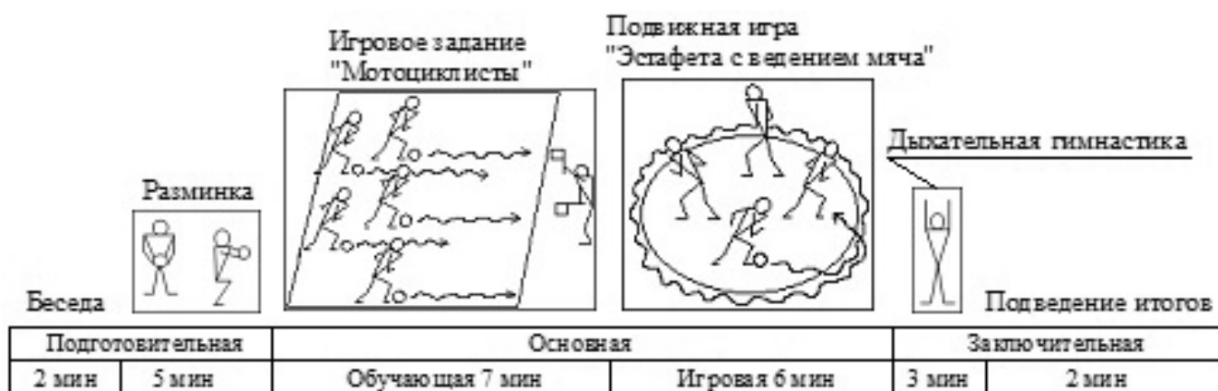
Рис. 2. Структура физкультурного занятия по теме «Обучение технике ведения мяча и развитие быстроты» (раздел «футбол»).