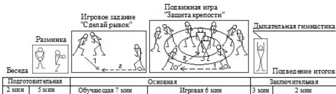
Рис. 3. Структура физкультурного занятия по теме «Обучение тактике и развитие наглядно-образного мышления» (раздел «футбол»).

Варианты построения физкультурных занятий с применением игровых заданий и подвижных игр с элементами футбола.