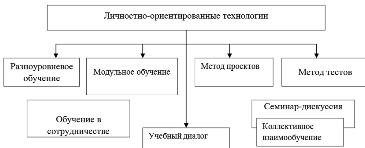
Рис. 1. Технологии личностно-ориентированного подхода

Преподаватель вуза в личностно-ориентированном процессе выступает в новом качестве (см. рис. 2).