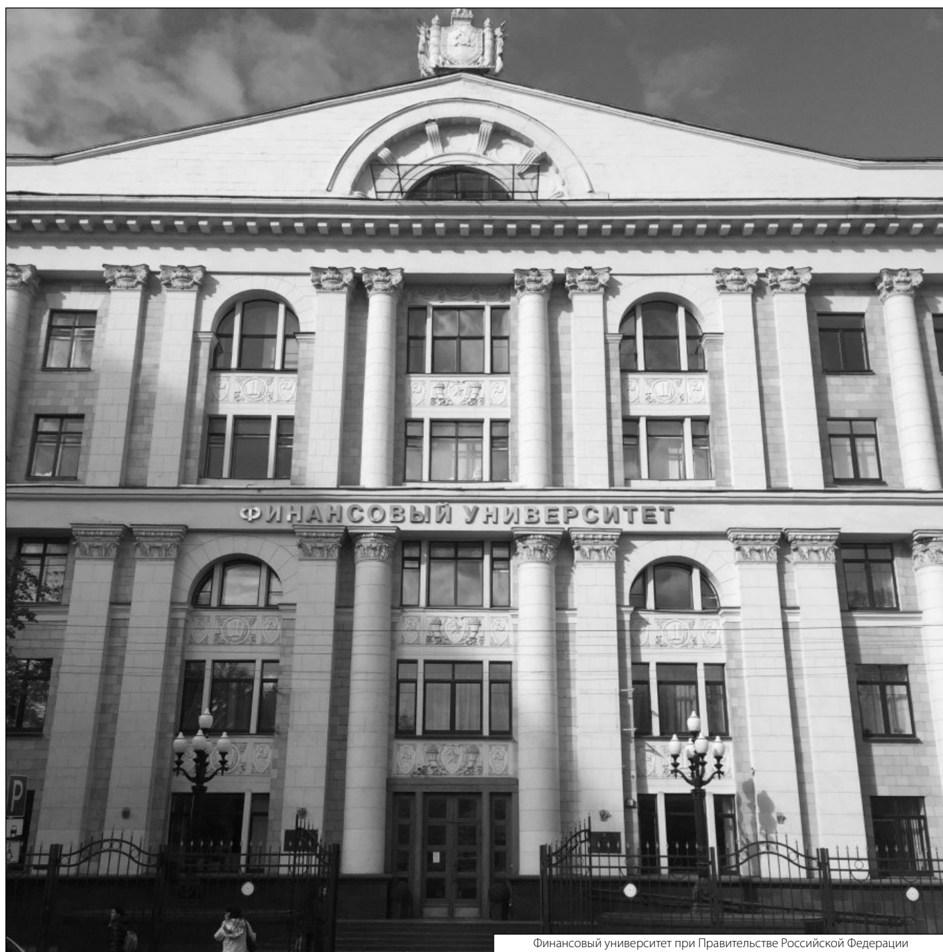
Финансовый университет при Правительстве Российской Федерации

© Молденхауэр Николай Андреевич ( nikolaj.moldenhauer@gmail.com ). Журнал «Современная наука: актуальные проблемы теории и практики»