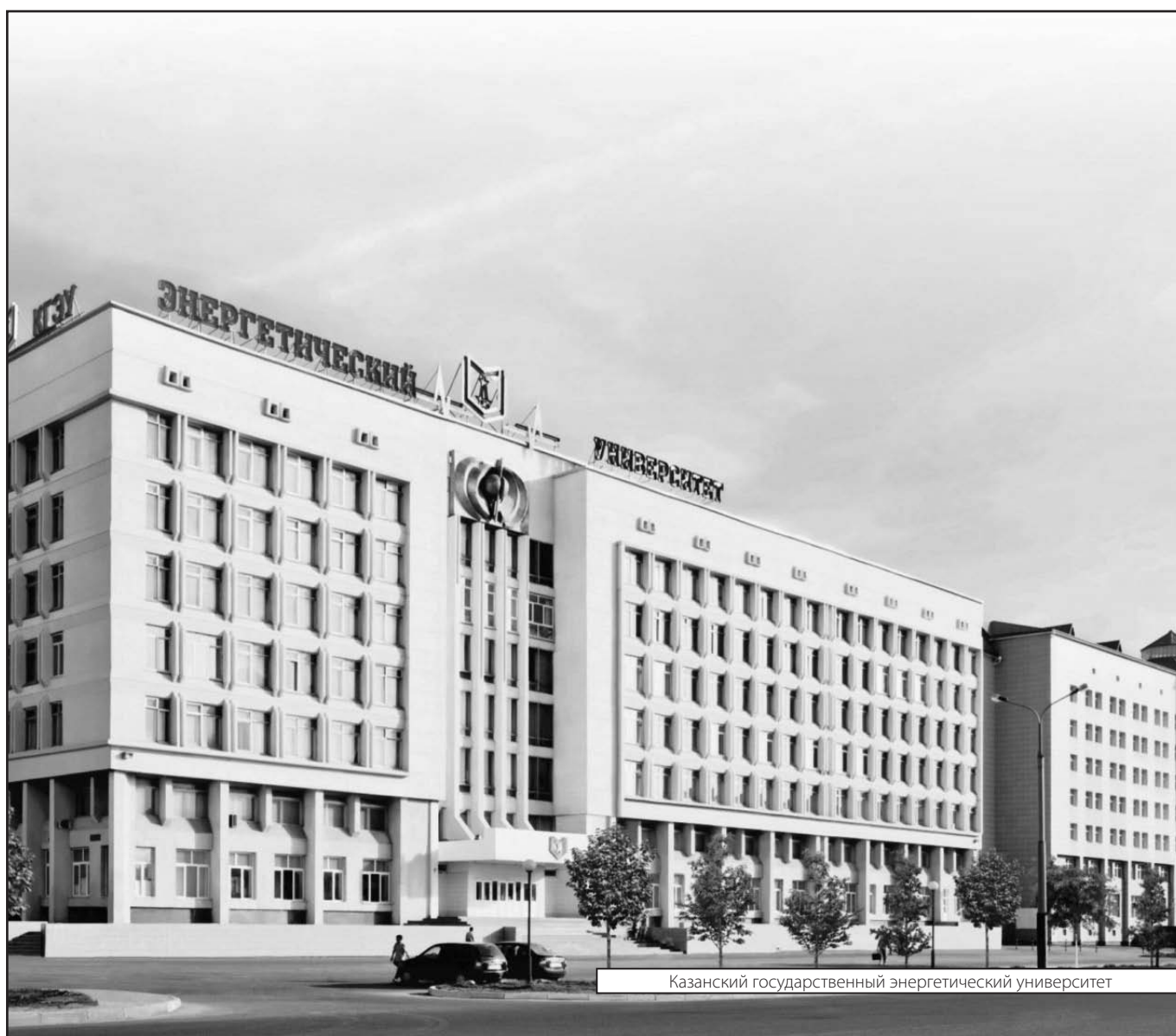
Казанский государственный энергетический университет

© Севодин Сергей Васильевич (sevodins@mail.ru), Земленухин Илья Андреевич (ilya.zemlenuhin@yandex.ru), Максименко Игорь Георгиевич, Сулейманов Габдыжалил Бариевич, Абрамов Николай Анатольевич. Журнал «Современная наука: актуальные проблемы теории и практики»