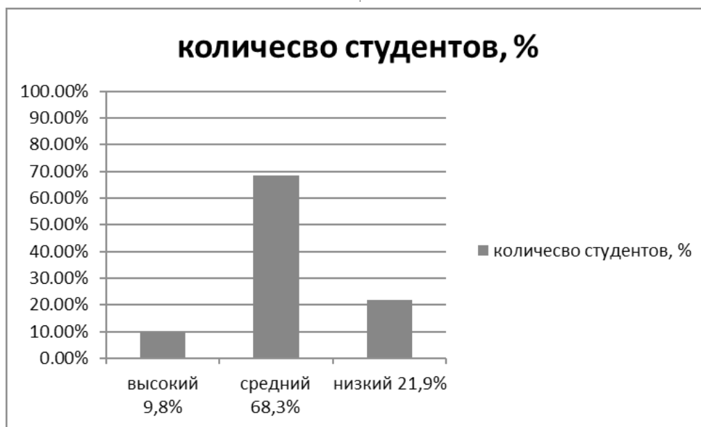
Рис. 1. Результаты исследования уровня тревожности студентов в вузе (Методика Тейлора)