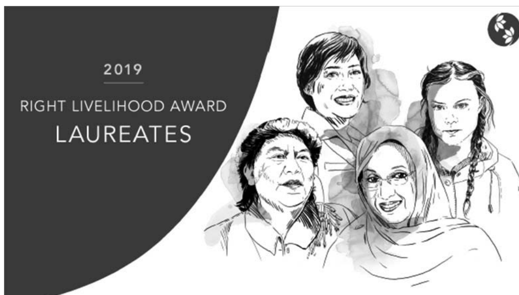
Рис. 8. Премия Right Livelihood Award

четверых визионеров, чья практическая деятельность позволяет миллионам людей защищать их фундаментальные права и бороться за достойное будущее на этой планете», – заявило жюри [1].