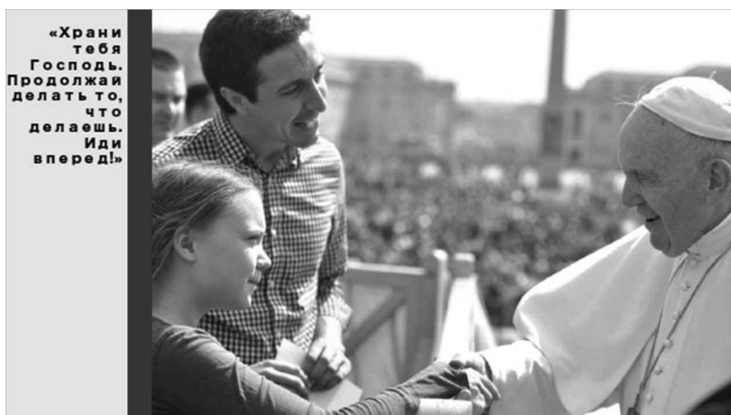
Рис. 6. Папа Франциск и Грета Тунберг

У Греты еще в возрасте 8 лет был выявлен ряд психических отклонений, таких как синдром Аспергера, обсессивно-компульсивное расстройство и селективный мутизм. Тунберг уверена, что она является исключительным человеком, наделенным особыми способностями: Я говорю только когда считаю это необходимым, и сейчас – такой момент [20]. Я обладаю даром видеть мир не таким, как остальные люди [22].