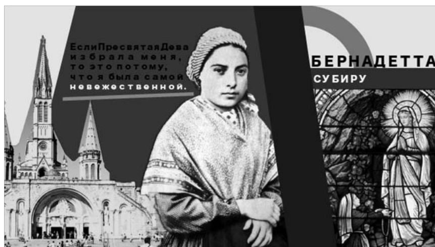
Рис. 1. Бернадетта Субиру

справедливости. Когда Иисус в Евангелии призывает нас обнаружить Царство Небесное, он приглашает нас открыть для себя мир как он есть и «другой мир». Там, где есть любовь, Бог присутствует. [6] Призыв к покаянию был услышан - к шестому видению в грот вместе с девочкой приходит около ста крестьян из окрестных селений. В первой статье, появившейся в местной газете, говорилось о «девочке, по всем признакам, подверженной каталепсии, будоражащей любопытство лурдского населения». Со всех сторон ей запрещали возвращаться в грот – к счастью, эти запреты были отменены, когда, – как пишет А. Сикари, – к чуду «проявили любопытство некоторые влиятельные лица» [9, с. 168] из числа высшего духовенства. На девятом видении Бернадетта, выполняя аскезу по приказу женщины, пьет грязную воду в углу грота и ест растущую там траву. На следую-