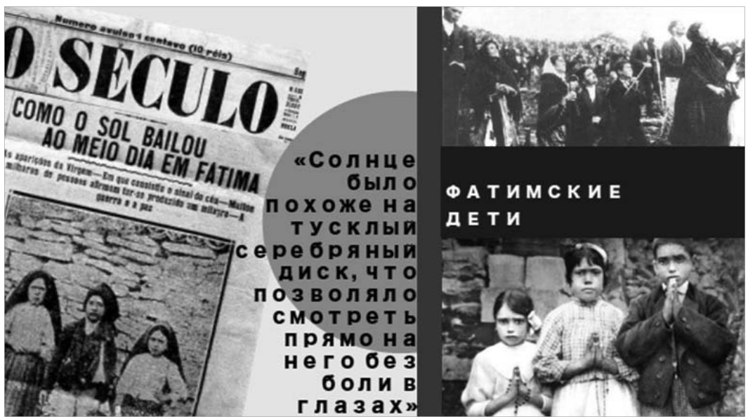
Рис. 2. Фатимские дети

13 августа дети не смогли посетить назначенное место, так как были задержаны и допрошены полицией по настоятельному требованию правительства Португалии. Детей запирают в участке, где их пытались заставить от-