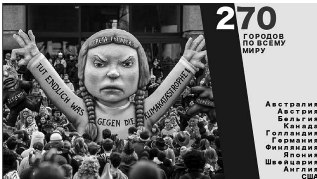
Рис. 5. Манифестации по всему миру