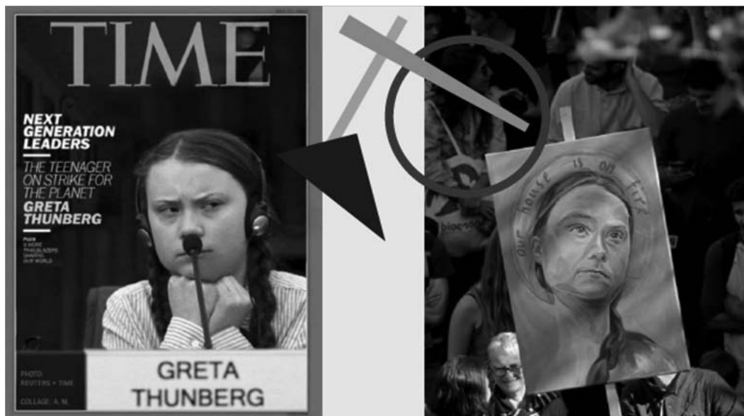
Рис. 13. Грета Тунберг - что ждет нас в будущем?

стремления к агрессивному преобразованию мира через художественную деятельность. В этом же русле лежит отождествление Греты себя, как медиума не с гласом Божиим (что, казалось, было бы естественно для дочери религиозных родителей) но с голосом поколения. Табуированность публичного упоминания идеи Бога есть еще одно из правил диктатуры толерантности: выбор одной из религиозных систем автоматически делает исповедующего её оратора противостоящим другим, а Грета хочет обращаться как можно к большему количеству слушателей. Впрочем, отдельные религиозные деятели готовы признать Грету гласом Божиим: так, лютеранская церковь в районе Лимхамн шведского города Мальмё объявила: «Иисус избрал Грету Тунберг в свои преемники». [14]