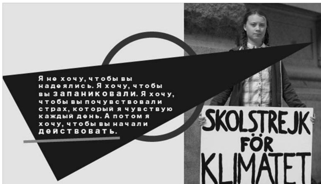
Рис. 3. Грета Тунберг у здания парламента