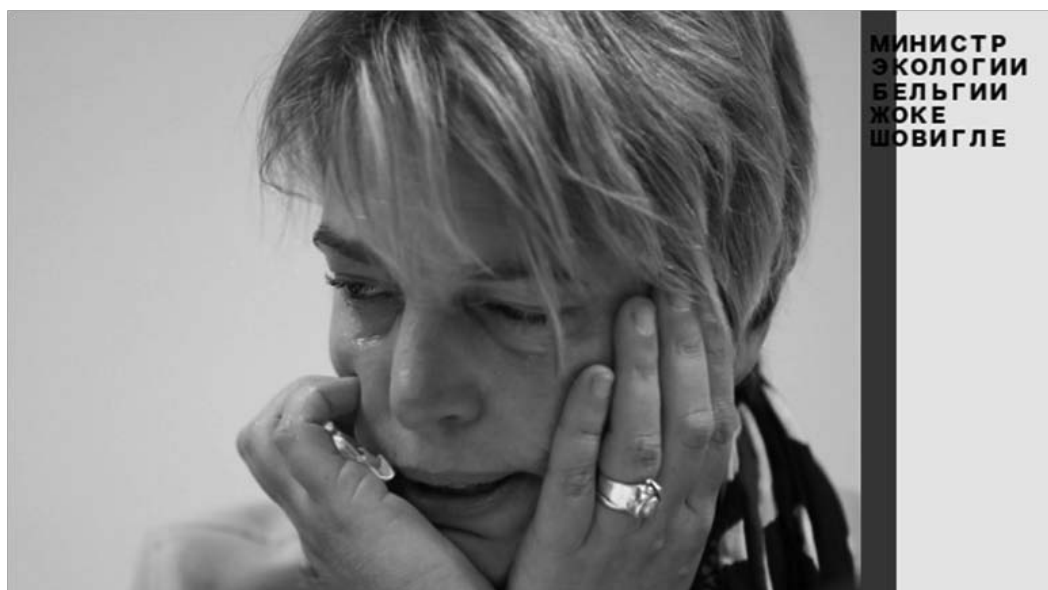
Рис. 7. Министр экологии Бельгии Жокке Шовигле