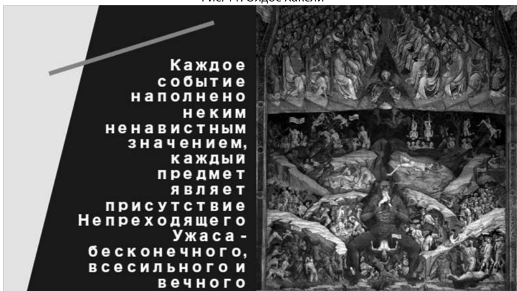
Рис. 12. Апокалиптические ожидания

тивистов (Дж. Д. Льюис-Уильямс, Т. Доусон, Р. К. Сигель, М. Е. Джарвик, Д. Дронфилд и др.) Эти исследователи полагали, что визионерство стоит подразделять на немедикаментозно инспирированное, к которому относятся врожденная способность медиума, редкие спонтанные проявления визионерства; гипноз или аутоусугестия; болезнь или сильная усталость; сенсорная изоляция; пост, аскетические практики самоистязания - «наложенное на самих себя наказание может оказаться дверью в рай» [13, с. 106], и медикаментозное (употребление психоактивных веществ). Для этой школы характерно относить визионерство к психиатрической симптоматике: «как симптомы серьезных психических заболеваний, хотя и не имеется адекватного медицинского объяснения и лабораторных данных, подтверждающих такую позицию». [2. - С. 233]