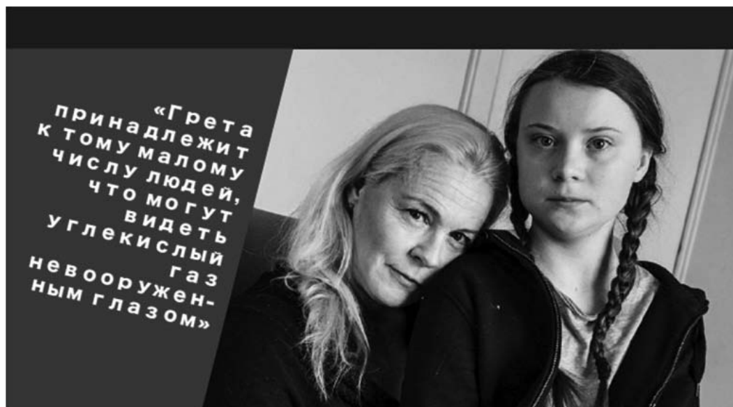
Рис. 4. Грета Тунберг с мамой

för klimatet), получающее мировое распространение под названием «Пятницы ради будущего» (англ. Fridays For Future, FFF). Через три месяца после появления Греты у здания парламента, в декабре 2018 года, во время Конференции ООН об изменении климата организованные студенческие и школьные забастовки в поддержку климатических требований проходят в 270 городах в Австралии, Австрии, Бельгии, Канаде, Голландии, Германии, Финляндии, Японии, Швейцарии, Англии и США [18]. Во время этих выступлений Грета встретила с генсеком ООН Антониу Гуттерришем, который одобрил забастовки, сказав: «Моему поколению не удалось должным образом отреагировать на серьезную проблему изменения климата. Это было принято близко к сердцу молодёжью. Неудивительно, что они разозлены» [21].