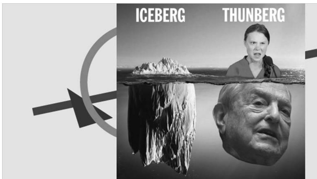
Рис. 10. Карикатура – Грета Тунберг и Ротшильд

не входит анализ предположений «кто стоит за Гретой Тунберг», нас интересует только резонансность её деятельности в контексте трансформации архетипа детско-го визионерства.