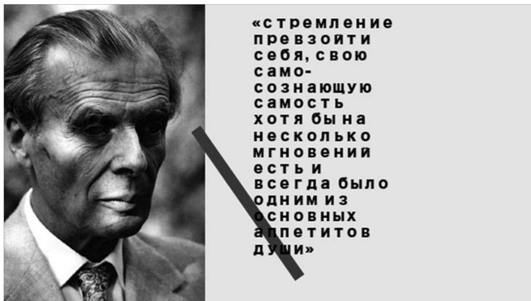
Рис. 11. Олдос Хаксли