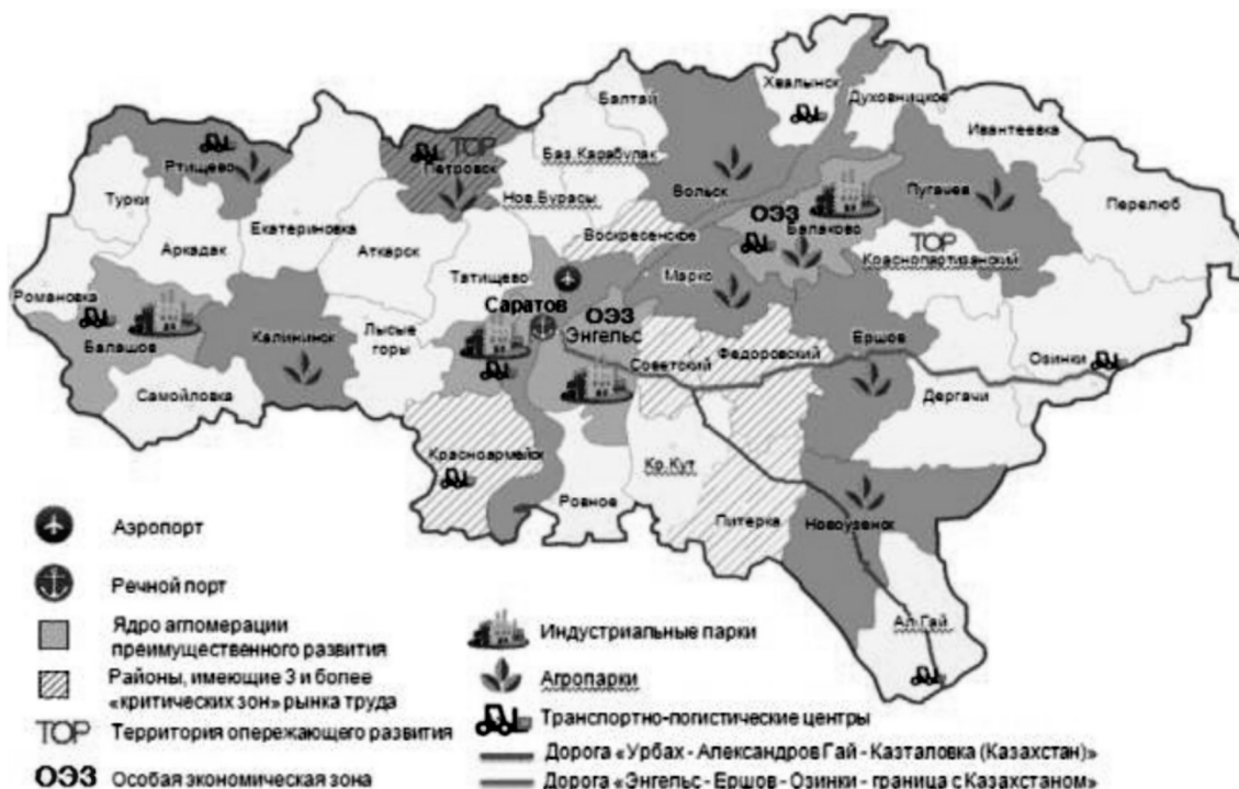
Рисунок 1. Территории преимущественного развития в Саратовской области.

Специфические цели формируются, исходя из особенностей конкретного района или его типа.