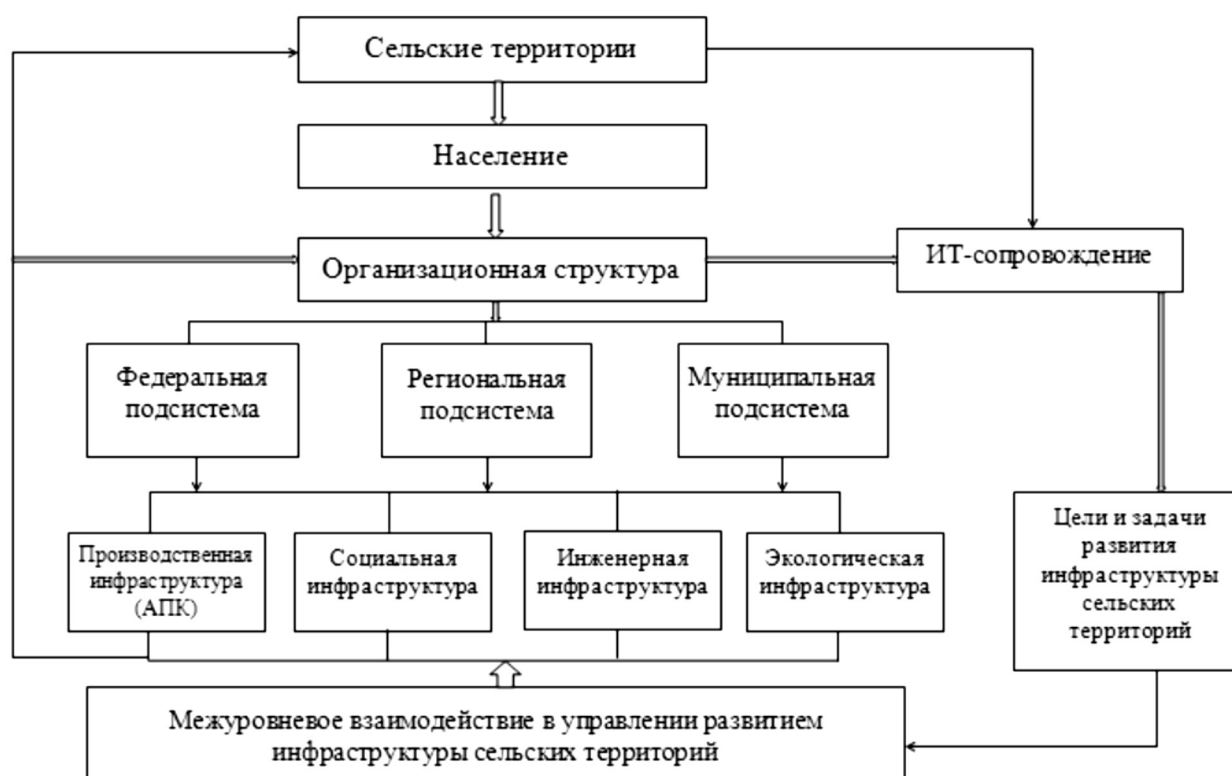
Рисунок 1. - Модель межуровневого взаимодействия в организационной структуре управления развитием инфраструктуры сельских территорий.

Отраслевое и иерархическое разнообразие субъектов и подсистем модели отражает комплементарность взаимодействий, предоставляющих дополнительные активы посредством аккумуляции ресурсов. В то же время на практике, в силу разницы в подготовке и квалификации управленцев, а также традиционной автономной направленности в деятельности может замедляться координация и наблюдаться внутрисистемная конкуренция с негативными последствиями. Организационная структура управления развитием инфраструктуры сельских территорий предполагает консолидацию, мотивацию и контроль, закрепляемые и накладываемые на существующие системы управления, пронизывающие вертикали власти по административному признаку. В данном случае это Министерство сельского хозяйства РФ, соответствующие органы управления АПК на региональном и муниципальном уровнях, на которые возложены функции реализаторов устойчивого развития сельских территорий.