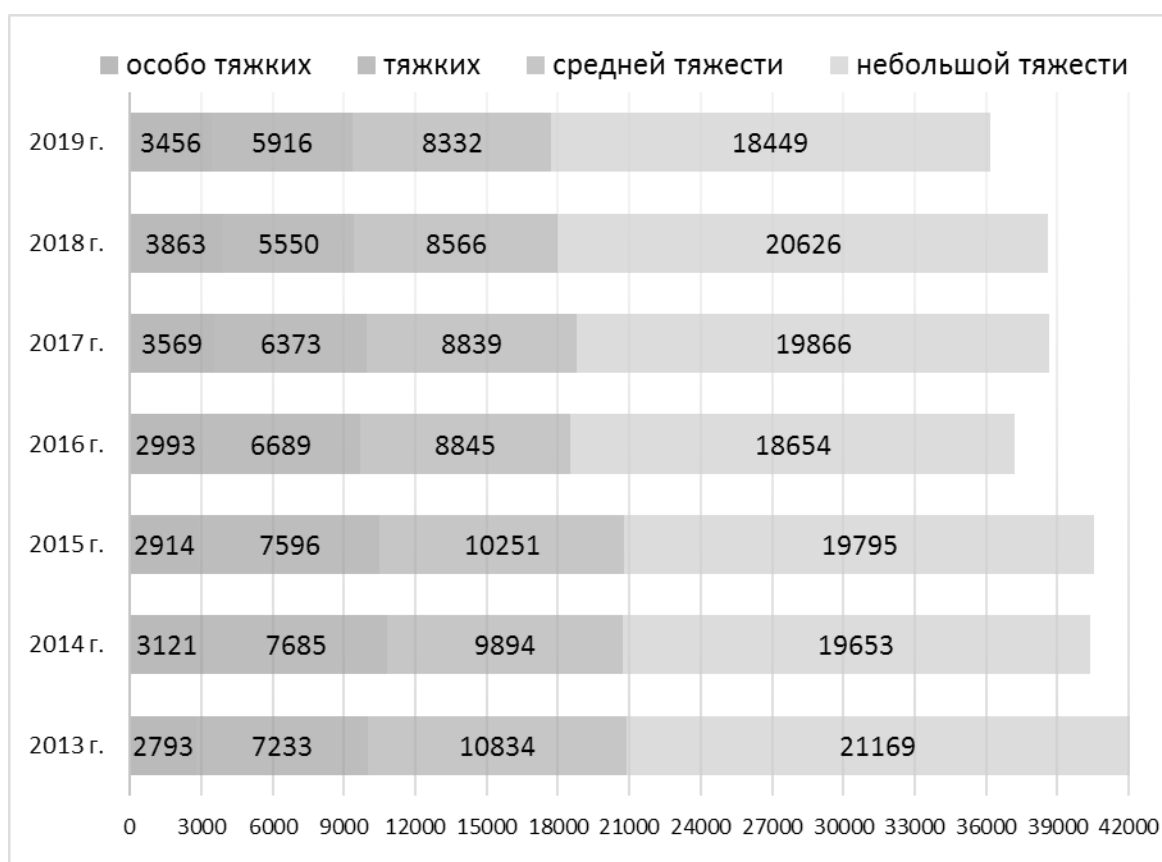
Рис. 1. Структура зарегистрированных преступлений на транспорте в России за 2013–2019 гг. (по категориям)

В анализируемом периоде предварительно расследовано не менее 64% преступлений от всех зарегистрированных на транспорте за год, что превосходит общую раскрываемость. Так в 2019 г. предварительно расследовано 52,0% от общего числа зарегистрированных преступлений в России, а в 2013 г. — 56,1%. Успешное раскрытие и эффективное расследование преступлений, совершаемых на объектах транспортной инфраструкту-