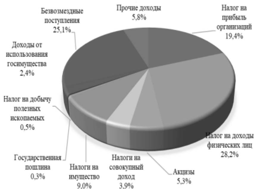
Рис. 2. Структура доходов консолидированных бюджетов субъектов РФ в 2020 г. (по данным РЭУ им. Плеханова. Анализ тенденций в бюджетно-налоговой сфере (дата обращения 27.11.2021г)

ваться процесс взыскания Инспекциями Федеральной налоговой службы России (далее — Инспекции) имущественных налогов с физических лиц в досудебном и судебном порядках.