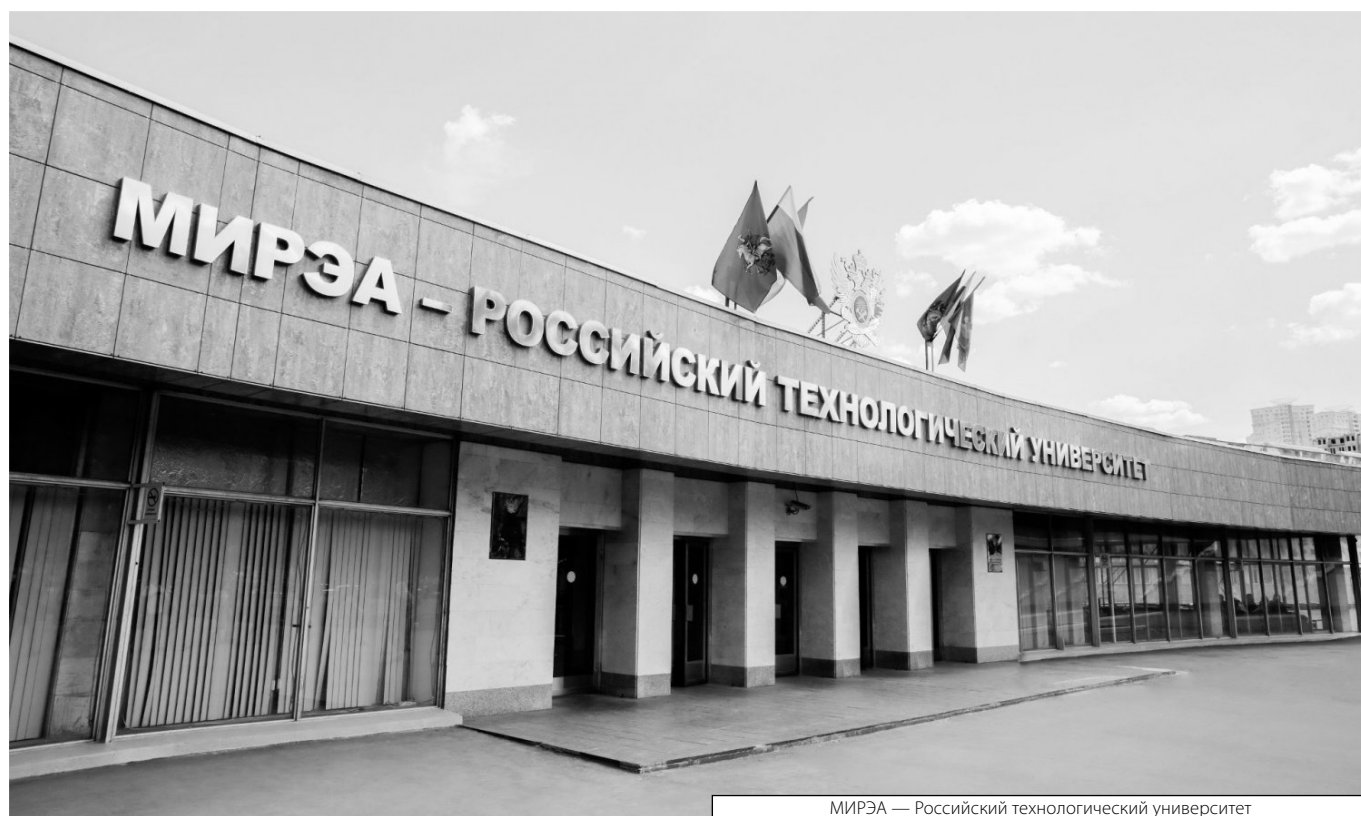
МИРЭА — Российский технологический университет

Журнал «Современная наука: актуальные проблемы теории и практики»