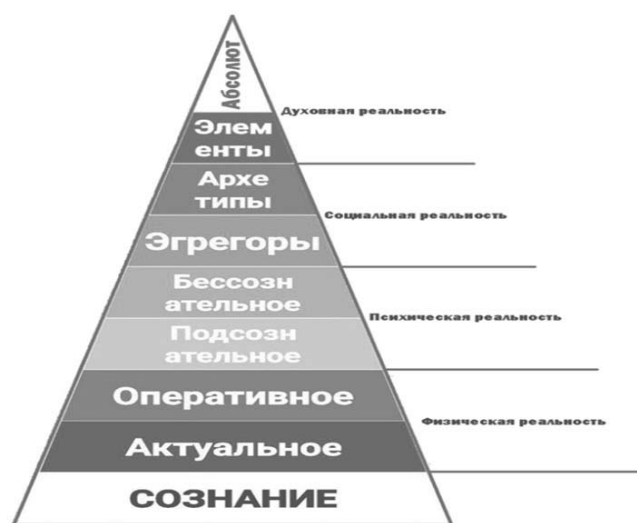
Рис. 1. Пирамида Бытия Грань «Сознание» по П.М. Пискареву (автор выражает благодарность Институту Психологии творчества за предоставление материалов и исследований https://metamodern.ru )

Концепция Пискарева П.М. основана на интеграции методов экзистенциальной и трансперсональной психологии, философской — основе квантовых метафор и подходов когнитивных наук полностью укладывается мета-теоретическую концепцию. В разрабатываемой Павлом Пискаревым методологии работы с внутренними психическими состояниями, включая процессы их регуляции, используется принцип иерархической модели, основанной на семиуровневой модели Пирамиды Мышления (рисунок 1) [19]. Модель Пирамиды Мышления содержит такие элементы, как Пирамида Бытия, Пирамида Социума, Пирамида Коммуникации, Пирамида Деятельности относительно правой и левой части внешней и внутренней среды индивидуума. В соответствии с теорией Метамодерна, содержащей четыре эпохи — Премодерна, Модерна, Постмодерна и Метамодерна, каждая из четырех Пирамид определяет соответствующий им квадрант бытия.