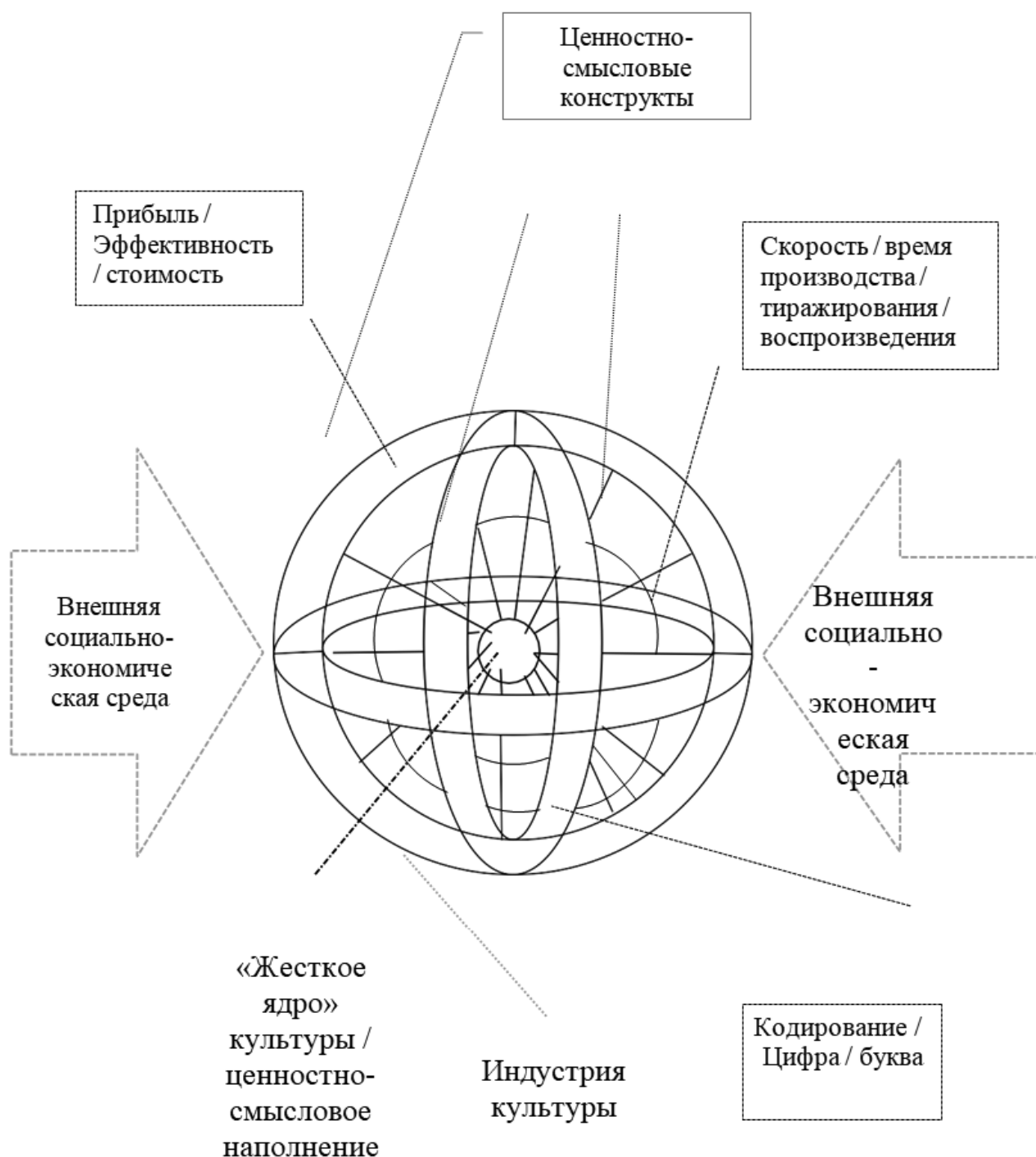
Рис. 4. Интегральная метадисциплинарная комбинация индустрии культуры

Исходя из разнообразия подходов к исследованию столь многосоставного явления как индустрия культуры представляется необходимым отказаться от выработки универсального подхода и использовать компоненты разных методологических подходов к исследованию, руководствуясь спецификой конкретной суботрас-