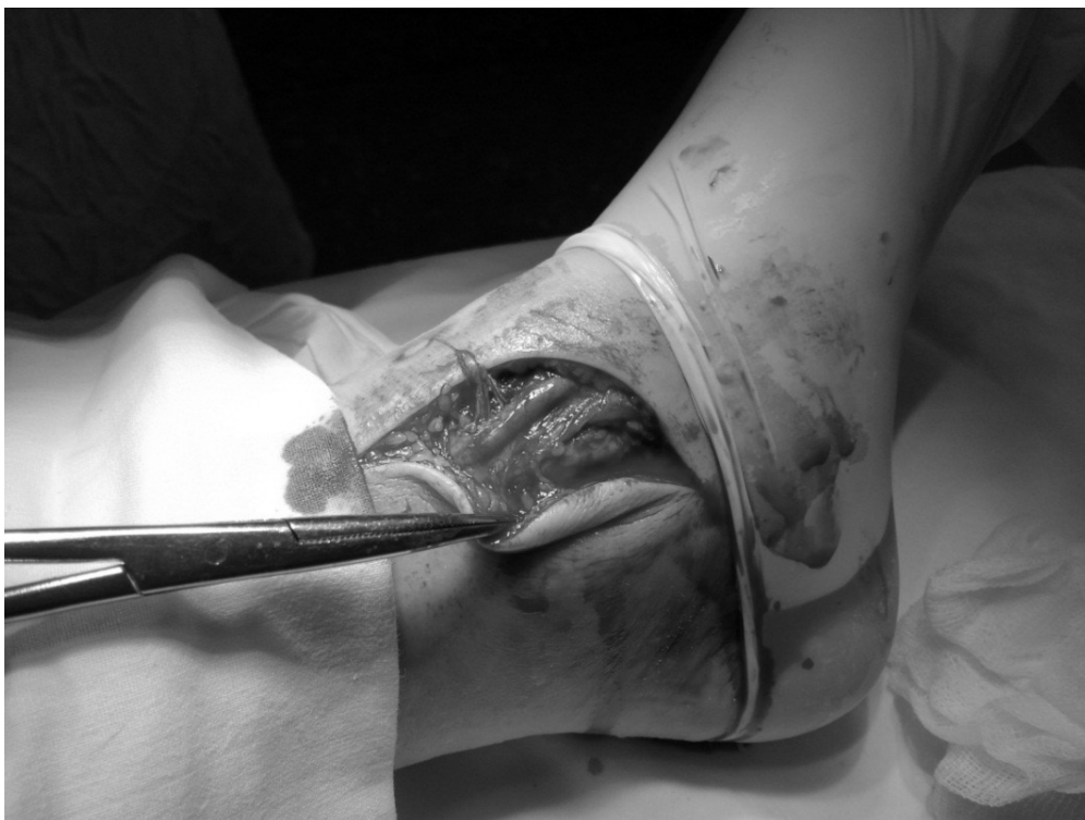
Рис. 3. Оперативный доступ на внутреннюю лодыжку с использованием разработанного способа. (Видна полностью сохраненная большая подкожная вена)

лению, операции проводились в начале исследования и оперирующие травматологи при доступе на внутреннюю лодыжку, при травме большой подкожной вены, просто перевязывали ее. Впоследствии при изучении данных пациентов отмечались начальные признаки венозной недостаточности в 92% случаев (119 пациентов из группы сравнения).