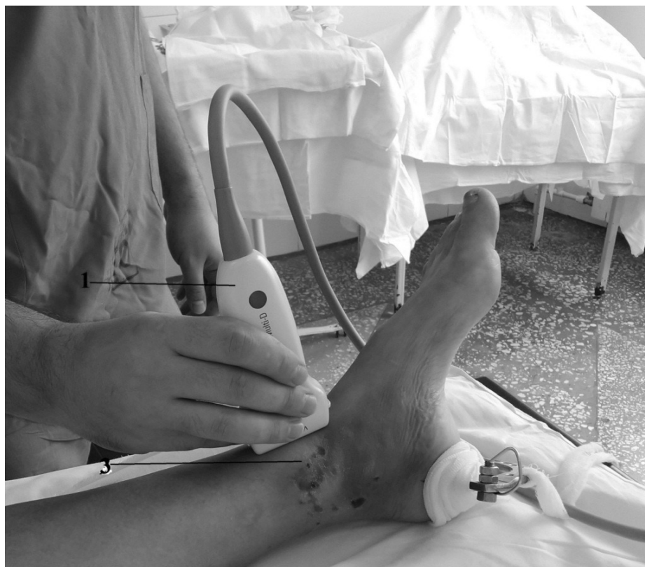
Рис. 1. Ультразвуковое исследование непосредственно в операционной