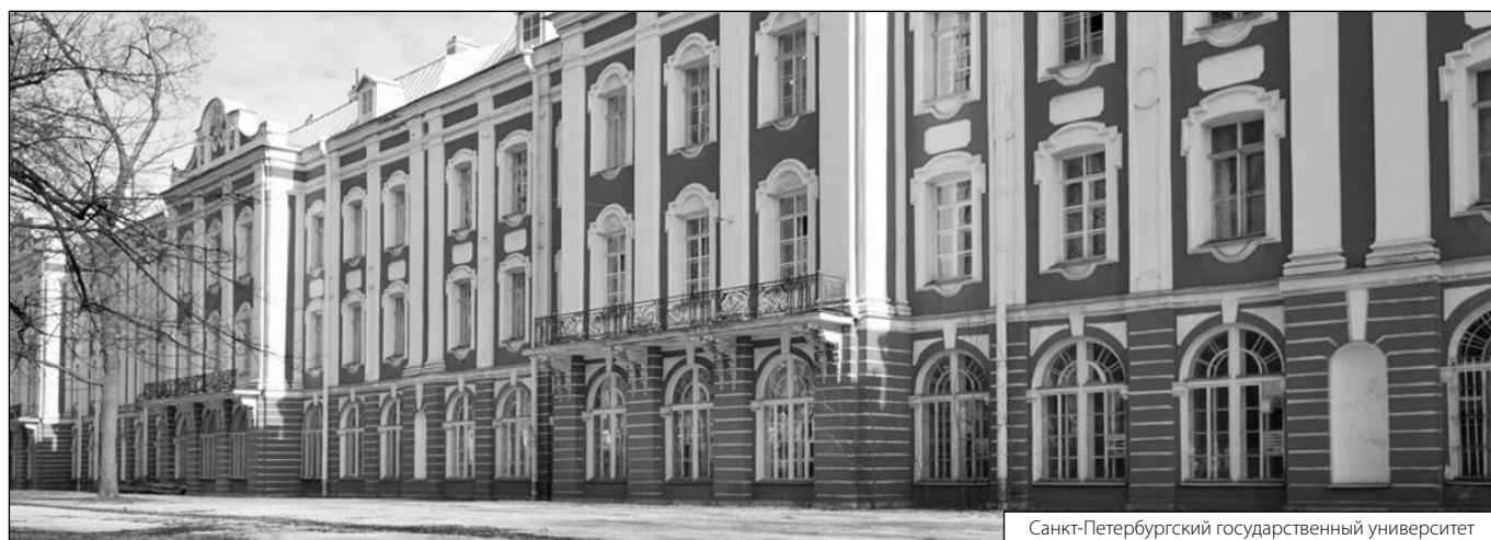
Санкт-Петербургский государственный университет

© Кильдишев Артём Вячеславович (artjom1987@mail.ru). Журнал «Современная наука: актуальные проблемы теории и практики»