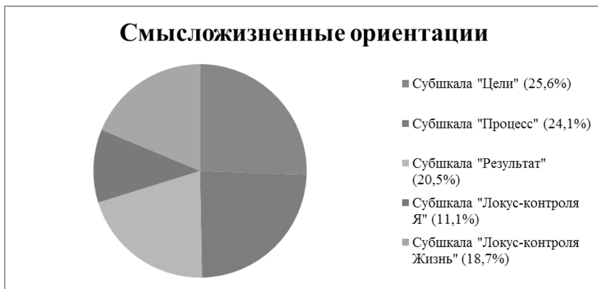
Рис. 3. Преобладание смыслоразностных ориентаций преподавателей после 30-ти лет

фессиональным опытом и, как следствие, для формирования псевдопозитивной идентичности.