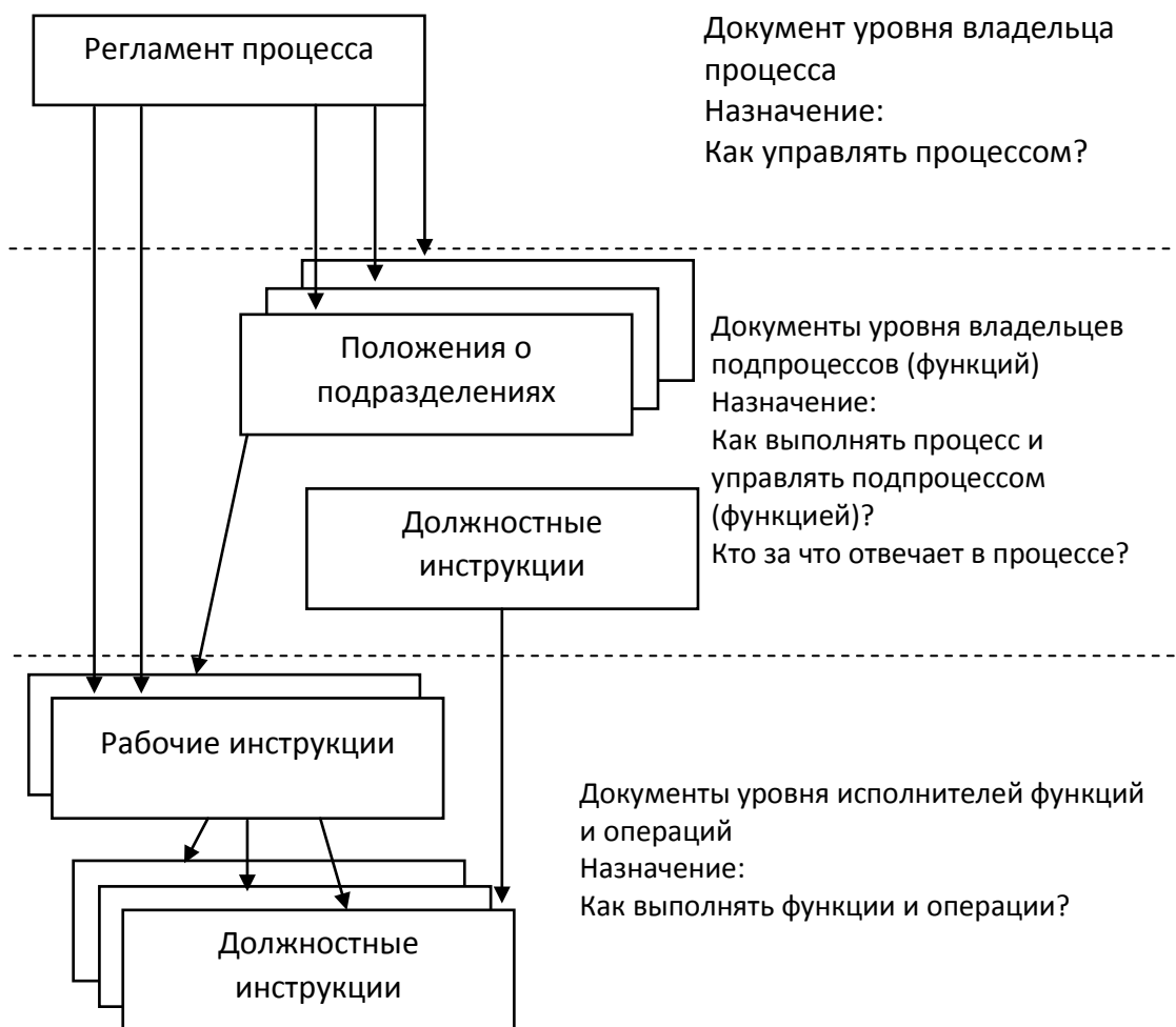
Рис. 3. Функциональная бизнес-модель формирования регламентов

Основываясь на уже описанных бизнес-процессах, следует разработать документ, описывающий порядок мониторинга статистики уровня качества труда персонала, функционирования бизнес-процессов, оценки эффективности [4]. При внесении каких-либо изменений в бизнес-процессы разрешается редактирование