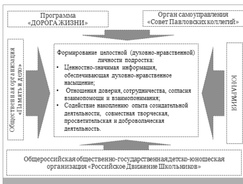
Рис. 1. Интегрированная модель образовательной среды, обогащенной духовно-нравственным содержанием, «Поле активности гимназиста»

средством амплификации традиционных дисциплин («Литература», «История», «Обществознание» и т.д.); введения специальных предметов и предметных областей в общем образовании («ОРКСЭ», «ОДНКНР»), внеурочной деятельности и дополнительном образовании; включения ценностно-значимой информации, сопряженной с глубинными смыслами, в воспитательные проекты, мероприятия, социальные практики, информационные контенты, организацию знаково-символической предметной среды; активной созидательной деятельности и конструктивно-ценностного общения учащихся, педагогов, родителей.