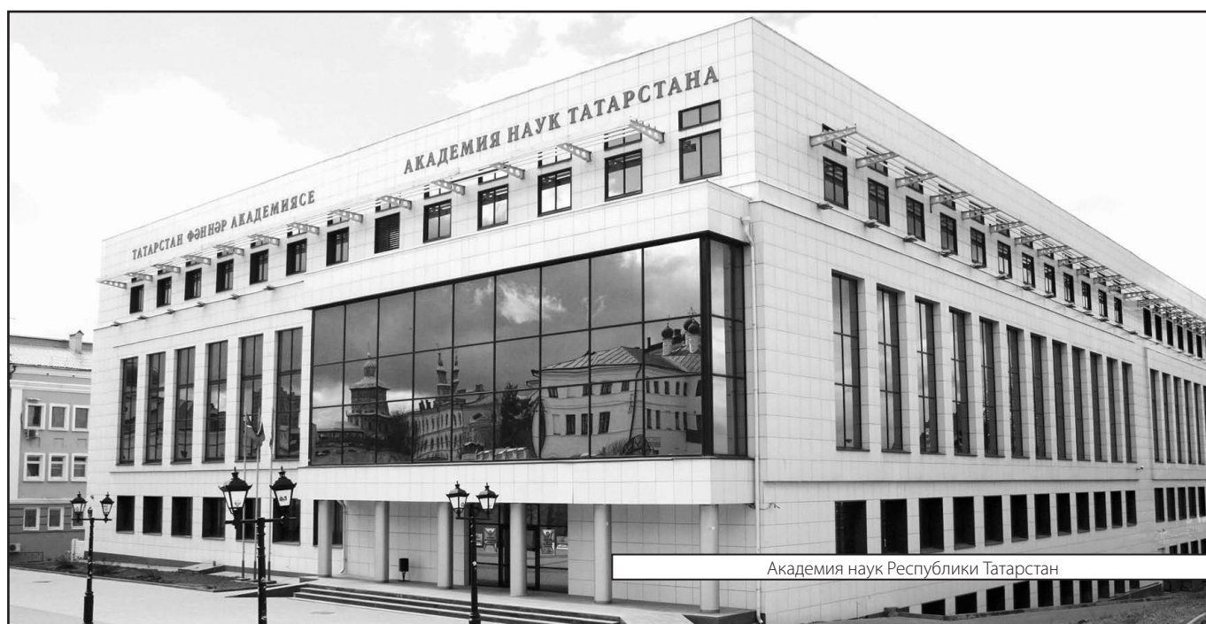
Академия наук Республики Татарстан

Журнал «Современная наука: актуальные проблемы теории и практики»