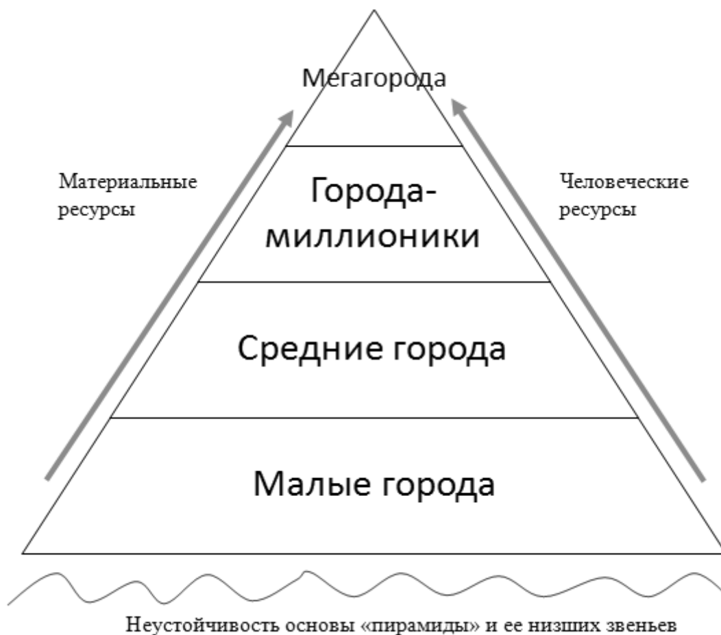
Рис. 2. Группировка городских поселений в РФ по численности населения [12]