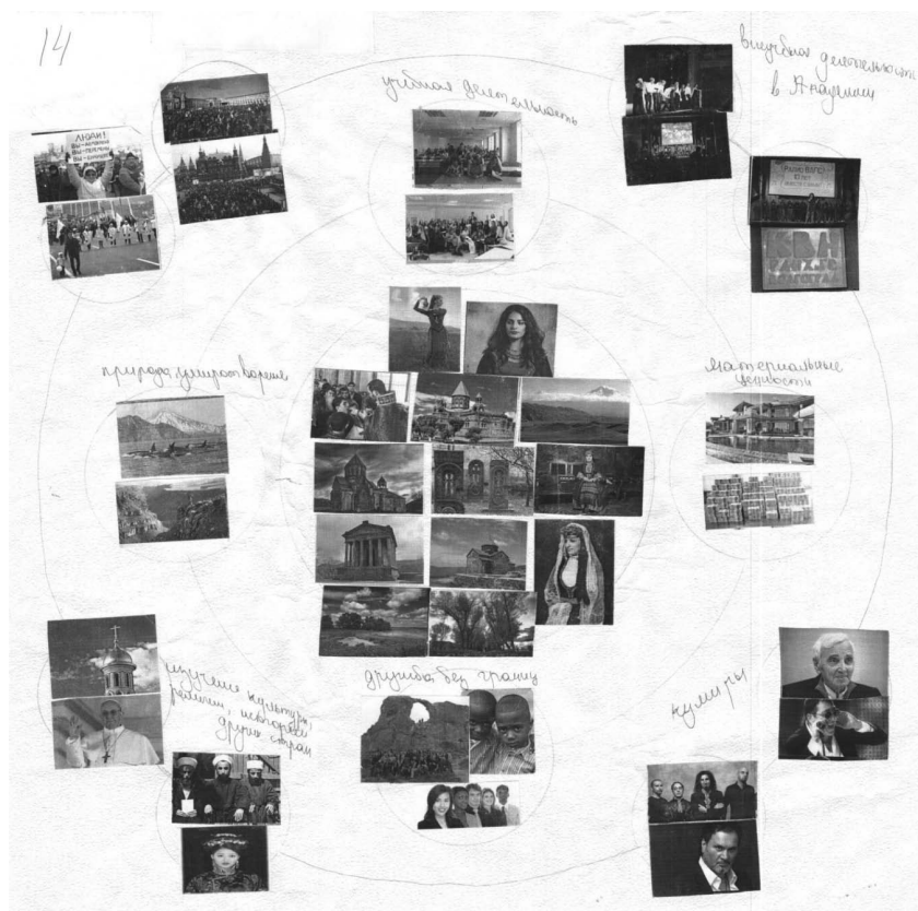
Рис. 4. Пример этноцентрированного коллажа

ской темы другие картинки этнического содержания или оттенка. Их расположение структурировано, например, исламская группа диаметрально противопоставлена израильской, буддистская символика объединена в группу с индийской. Отдельное семантическое гнездо образует на периферии (в третьем круге) символика Китая (у 2-х респондентов). Остальное пространство либо пустое, либо частично заполнено нейтральными изображения-