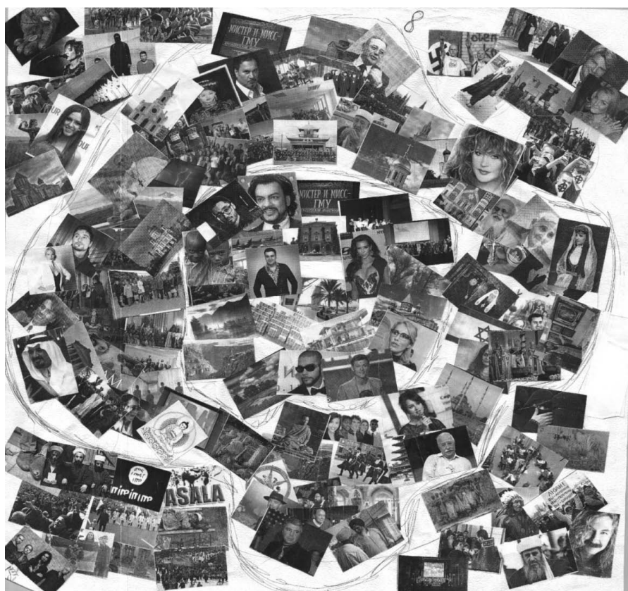
Рис. 2. Пример масс-культурной установки при выполнении задания

В группе этнических армян большинство респондентов проигнорировали «неприятные» картинки, вовсе не включив их в коллаж. В качестве основной проявились этноцентристские установки.