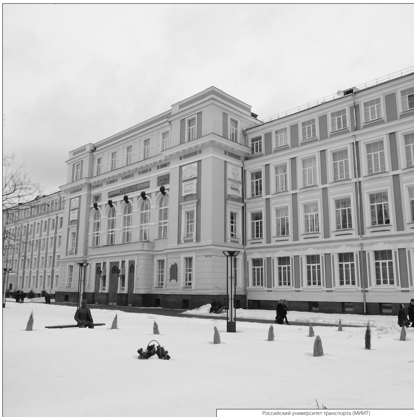
Российский университет транспорта (МИИТ)

Журнал «Современная наука: актуальные проблемы теории и практики»