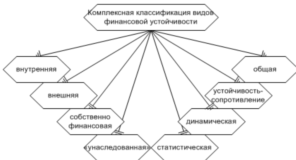
Рис. 3. Комплексная классификация видов финансовой устойчивости предприятия

Например, касательно экономического субъекта она может быть, в зависимости от факторов, принимающих влияние на его экономико-финансовую деятельность, внутренней, внешней, собственно финансовой.