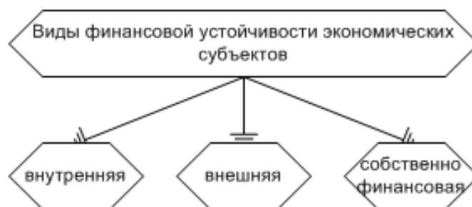
Рис. 2. Виды финансовой устойчивости касательно экономического субъекта