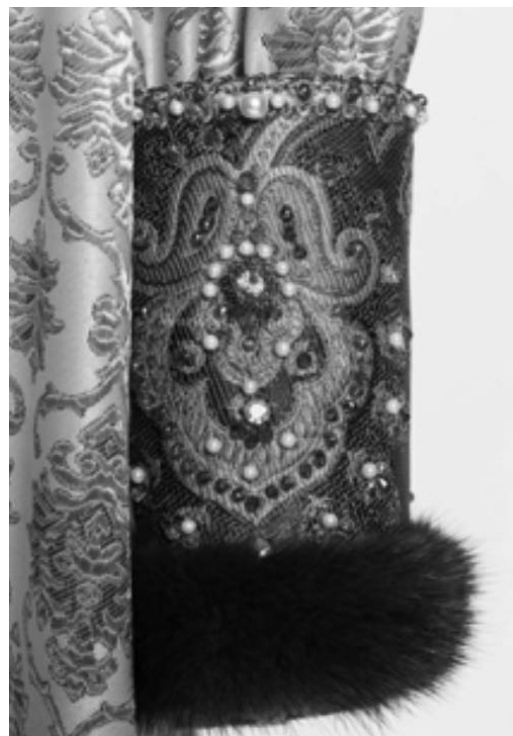
Илл.3. Наручи. Реконструкция. XIX в. Северные губернии России. Реконструкция выполнена по сохранившемуся описанию. Ткань, кожа, мех, жемчуг речной, золотные нити.