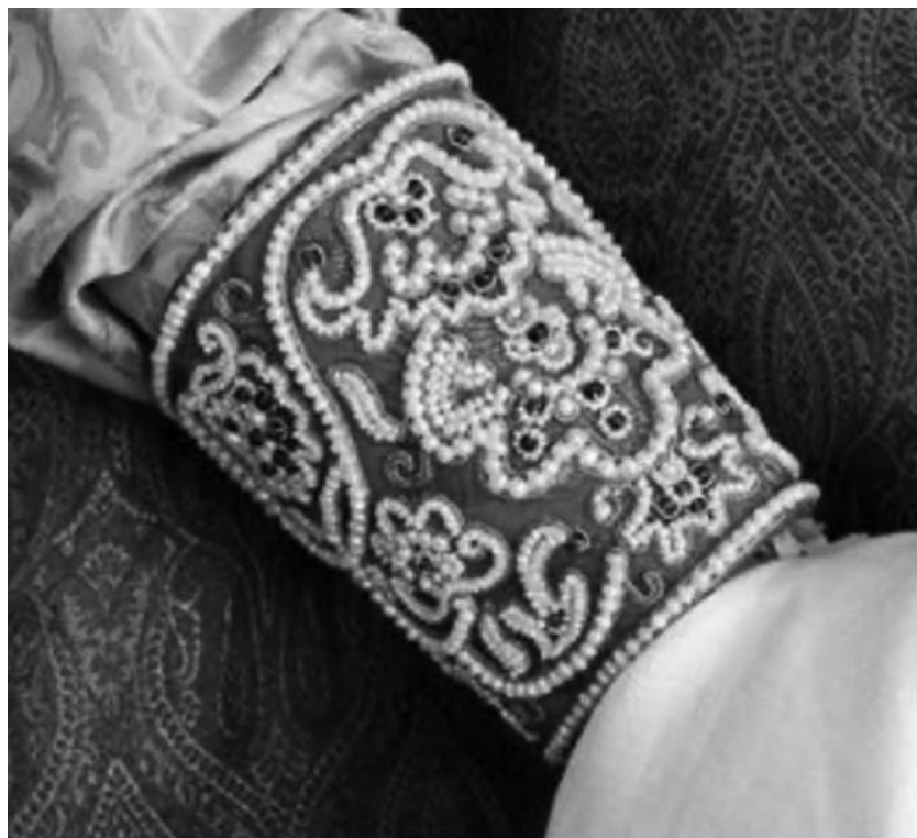
Илл.1. Наручи. Реконструкция. XVII-XIX вв. Северные губернии России. Реконструкция выполнена по сохранившемуся описанию и аналогам из собрания РЭМ. Ткань, жемчуг речной, золотные нити; техника «сажения по бели».