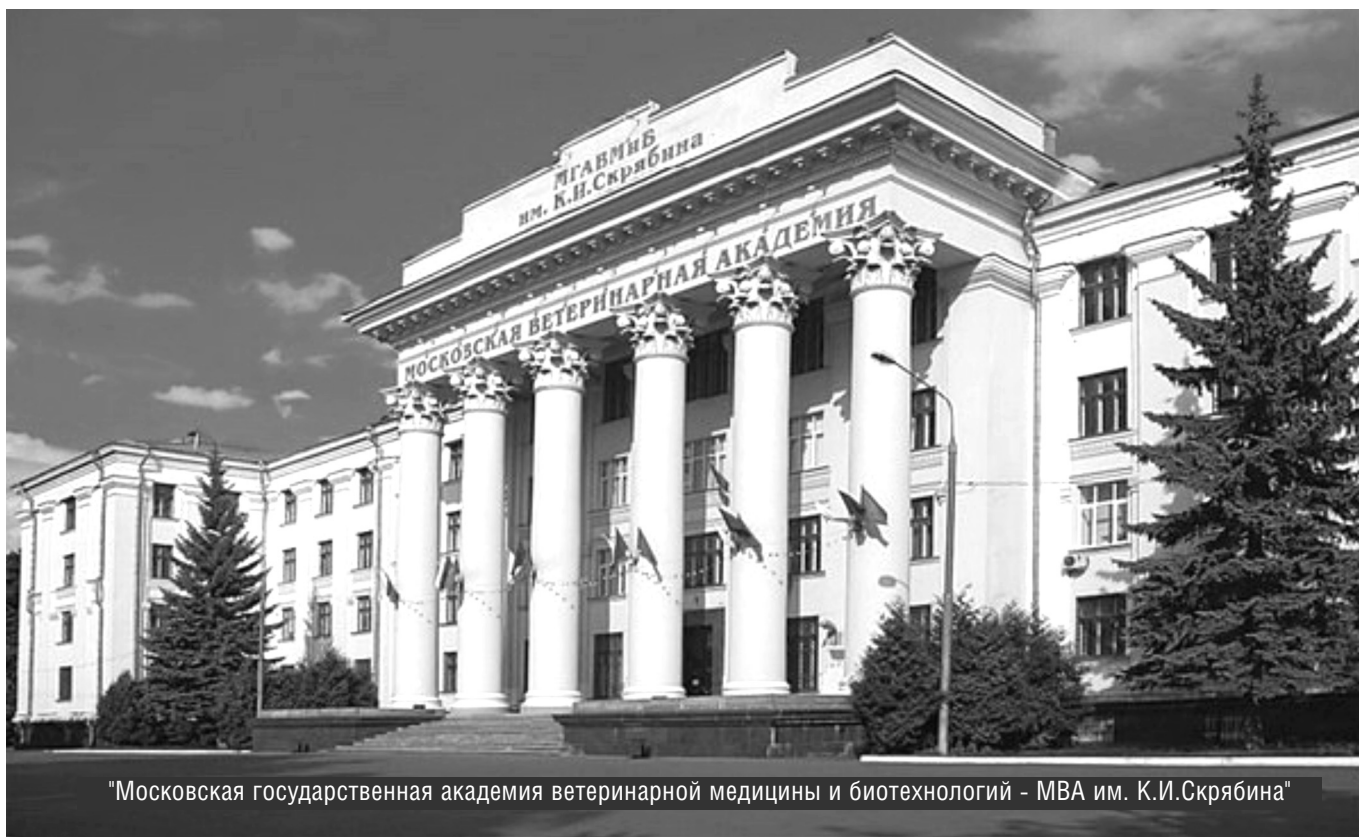
"Московская государственная академия ветеринарной медицины и биотехнологий - МВА им. К.И.Скрябина"

© А.В. Козлов, О.А. Яковлева, Ю.Б. Миндлин, (kozlov_rosniik@mail.ru), Журнал «Современная наука: актуальные проблемы теории и практики»,