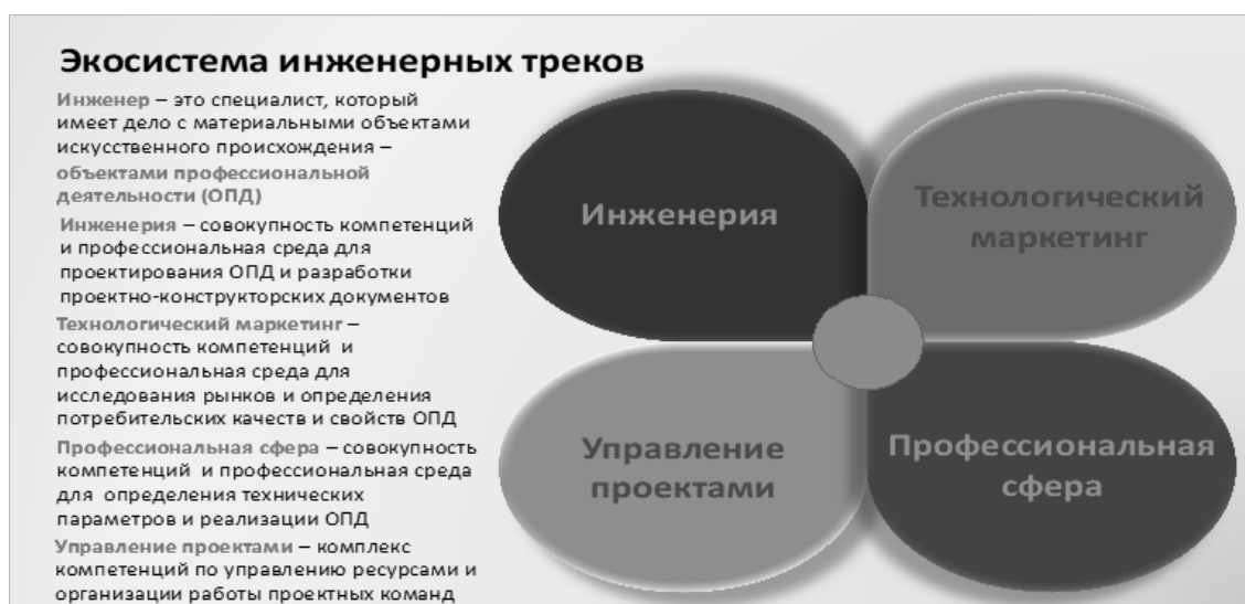
Схема 1. Экосистема инженерных треков кафедры радиоэлектроники и электроэнергетики Сургутского государственного университета.

В инженерных треках при проектировании учитываются все этапы жизненного цикла изделия, хотя и в ограниченном (учебном) виде. Результатом трека является прототип. Прототип – образец конечного изделия на разных стадиях его разработки – концепция, модель (темплет), проектный макет, рабочий макет, опытный образец. Инженерный трек реализуется на этапах