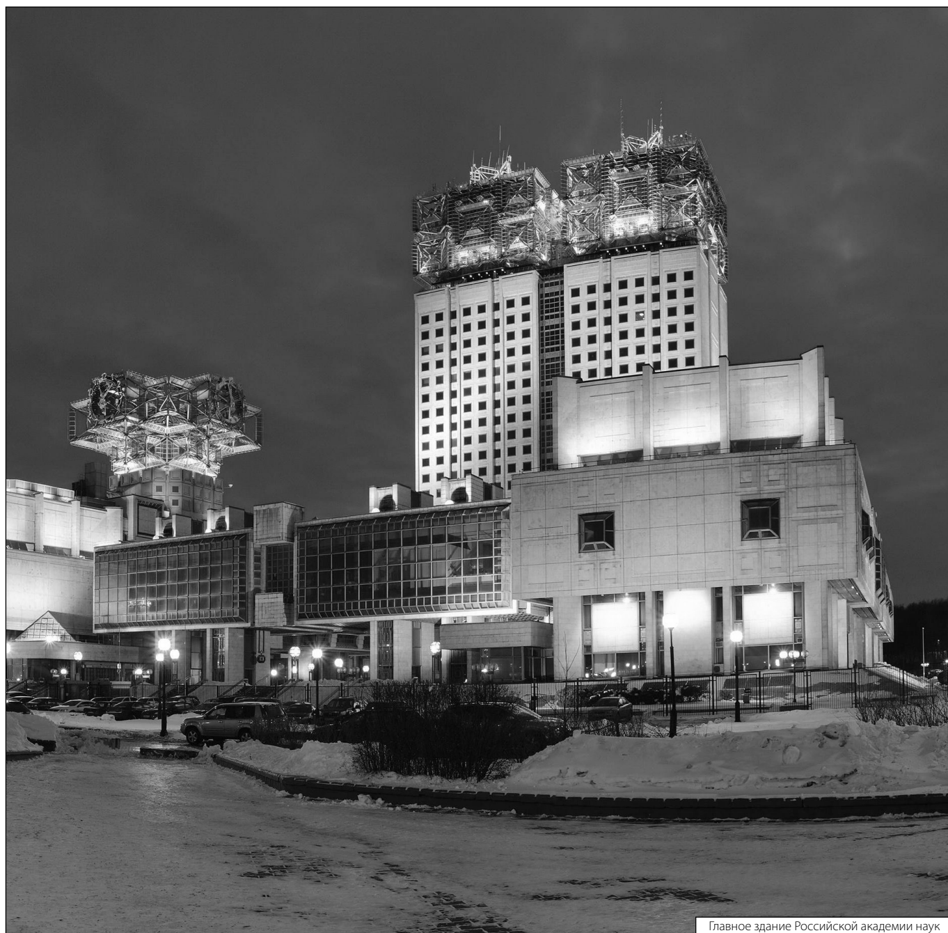
Главное здание Российской академии наук

Журнал «Современная наука: актуальные проблемы теории и практики»