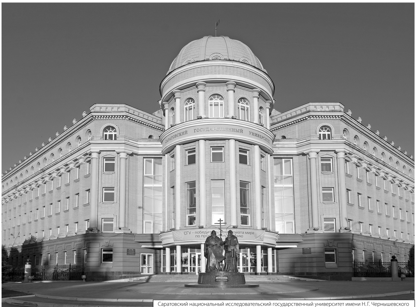
Саратовский национальный исследовательский государственный университет имени Н.Г. Чернышевского

Журнал «Современная наука: актуальные проблемы теории и практики»