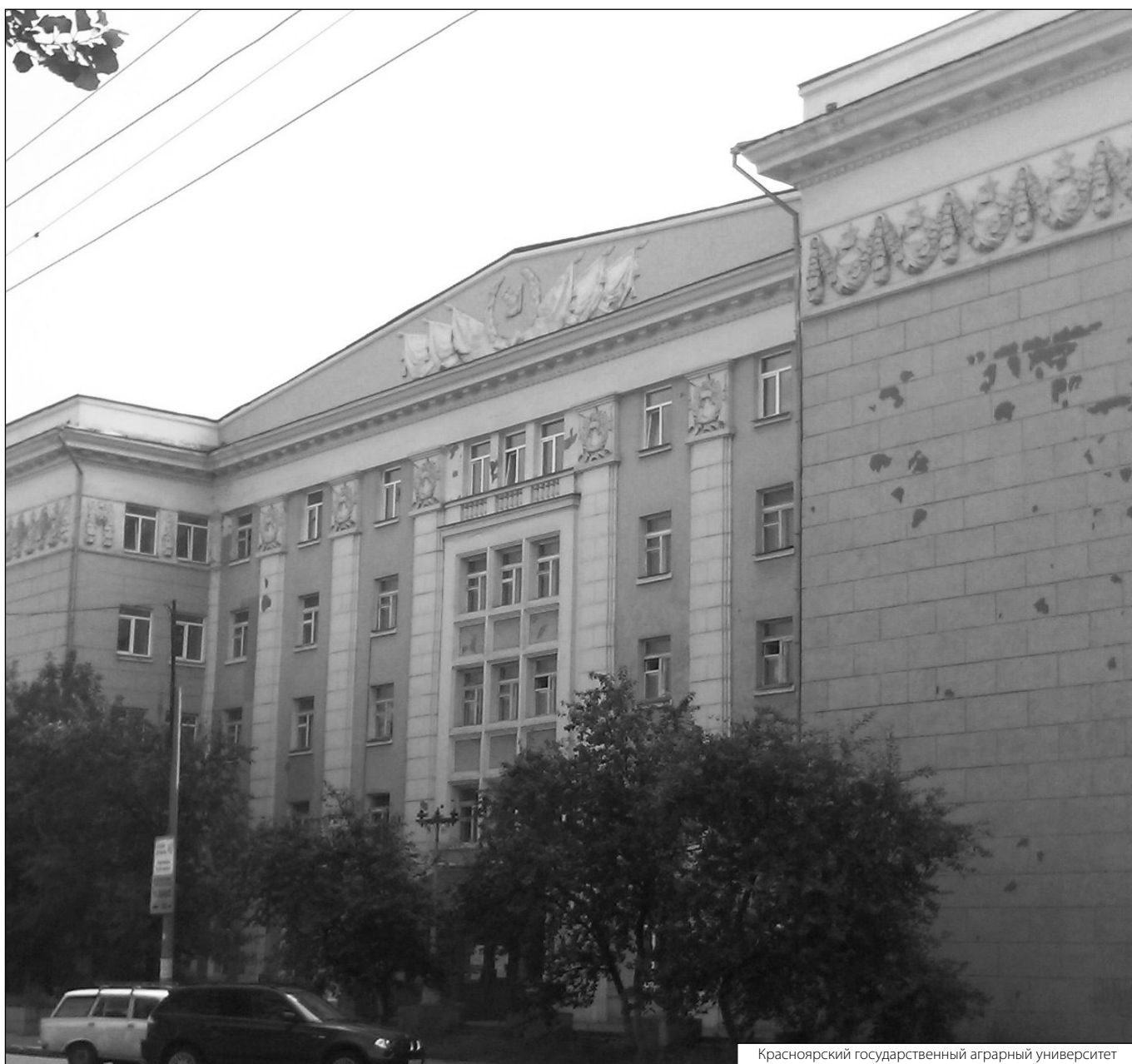
Красноярский государственный аграрный университет

Журнал «Современная наука: актуальные проблемы теории и практики»