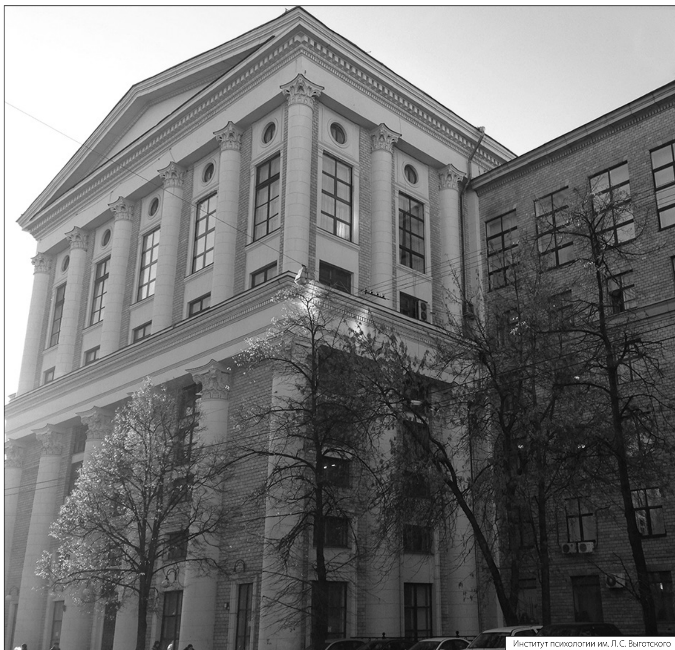
Институт психологии им. Л.С. Выготского