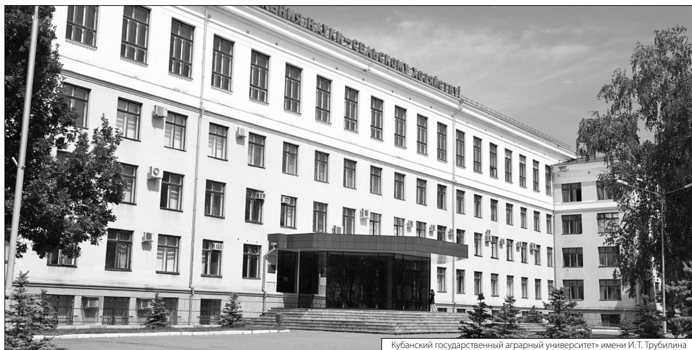
Кубанский государственный аграрный университет» имени И. Т. Трубилина

© Лугинина Анна Григорьевна, Никитин Григорий Михайлович ( p20347@mail.ru ). Журнал «Современная наука: актуальные проблемы теории и практики»