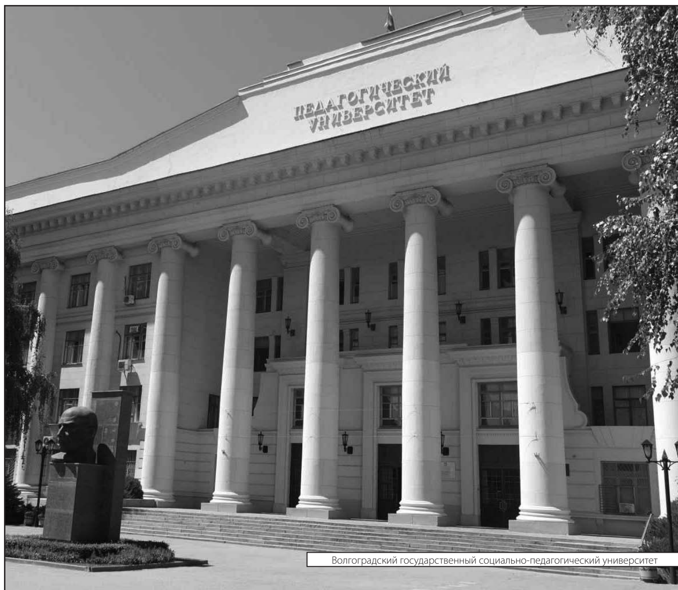
Волгоградский государственный социально-педагогический университет

Журнал «Современная наука: актуальные проблемы теории и практики»