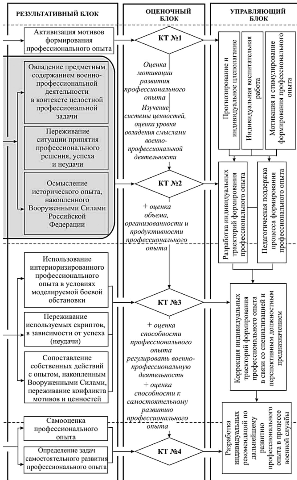
Рисунок 1/2. Обобщенная модель процесса формирования профессионального опыта курсантов военного вуза в процессе практической подготовки.