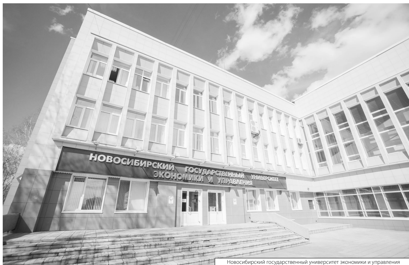
Новосибирский государственный университет экономики и управления

Журнал «Современная наука: актуальные проблемы теории и практики»