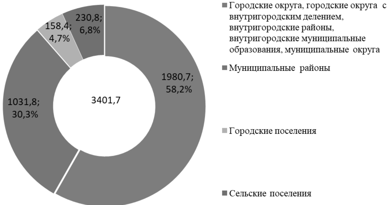
Рис. 2. Распределение собственных доходов муниципальных бюджетов по видам муниципальных образований в 2020 г.

ного сообщества в процесс управления муниципальным образованием.