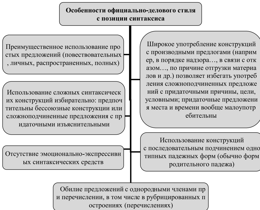
Рис. 4. Особенности официально-делового стиля с позиции синтаксиса [5, с. 463]