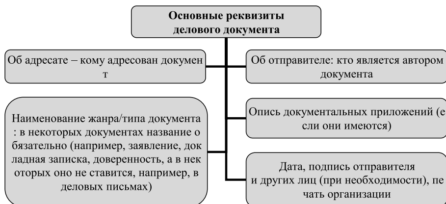
Рис. 1. Основные реквизиты делового документа [5, с. 463]