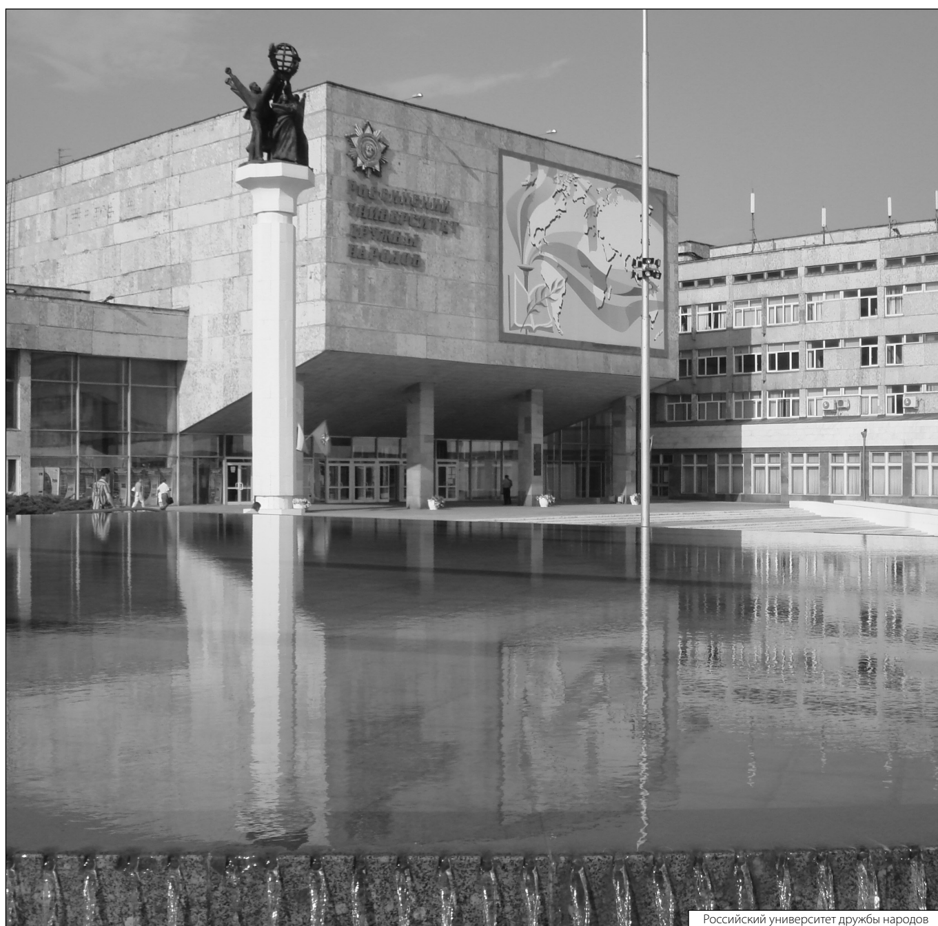
Российский университет дружбы народов

Журнал «Современная наука: актуальные проблемы теории и практики»