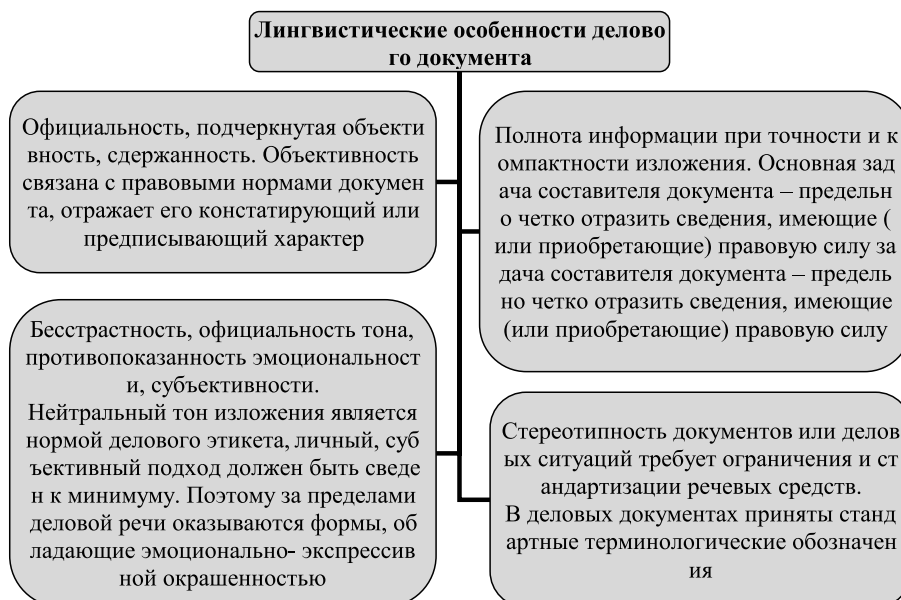
Рис. 2. Лингвистические особенности делового документа [5, с. 463]

Обычно официально-деловой стиль разделяют на два основных подстиля: