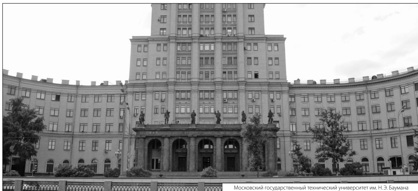
Московский государственный технический университет им. Н.Э. Баумана

Журнал «Современная наука: актуальные проблемы теории и практики»