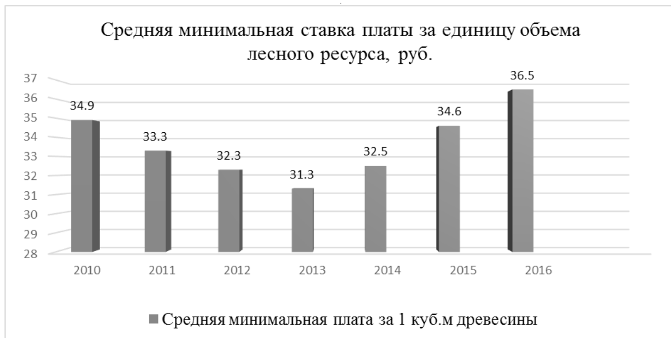
Рис. 3. Средняя минимальная ставка платы за единицу объема лесного ресурса, руб.

России от 22 мая 2007 г. № 310 «О ставках платы за единицу объема лесных ресурсов и ставках платы за единицу площади лесного участка, находящегося в федеральной собственности». [2] На основании этих ставок при проведении аукционов при продажах права на заключение договоров аренды или купли-продажи лесных насаждений определяется минимальная стартовая цена лота, которая, к сожалению, и становится конечной ценой аукциона. Причина этого кроется в плохом качестве организационных работ по подготовке аукционов по передаче лесных участков в аренду в субъектах РФ и низкой конкуренции (не более двух участников аукциона).