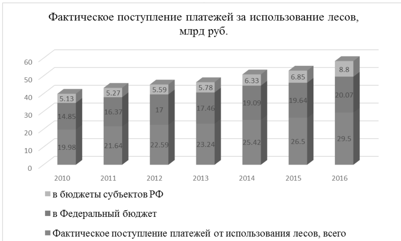
Рис. 1. Фактическое поступление платежей за использование лесов, млрд.руб.