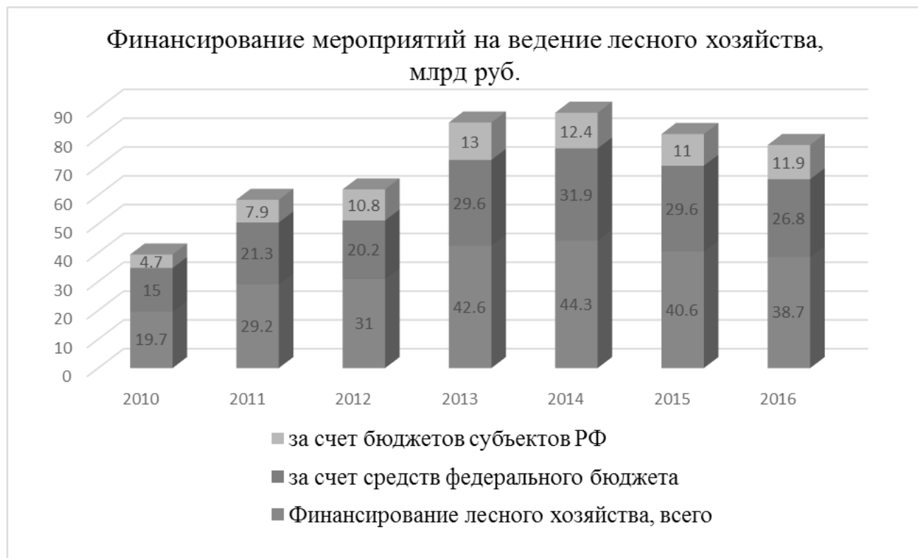
Рис. 2. Финансирование мероприятий на ведение лесного хозяйства, млрд.руб.