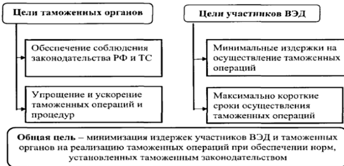
Рисунок 1. Цели таможенных органов стран-членов Таможенного союза и участников ВЭД и их взаимодействие.