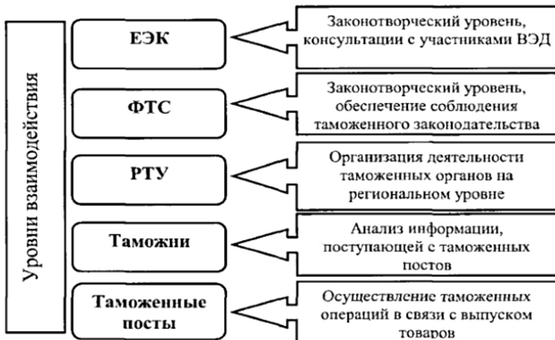
Рисунок 2. Уровни взаимодействия.