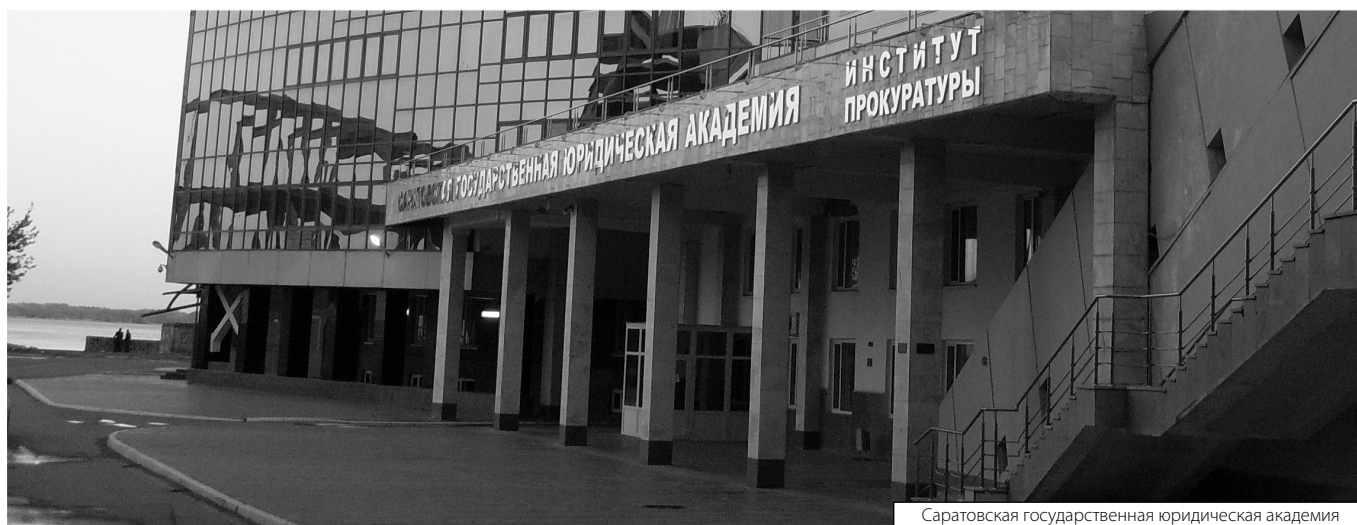
Саратовская государственная юридическая академия

© Бескова Татьяна Викторовна (tatbeskova@yandex.ru). Журнал «Современная наука: актуальные проблемы теории и практики»