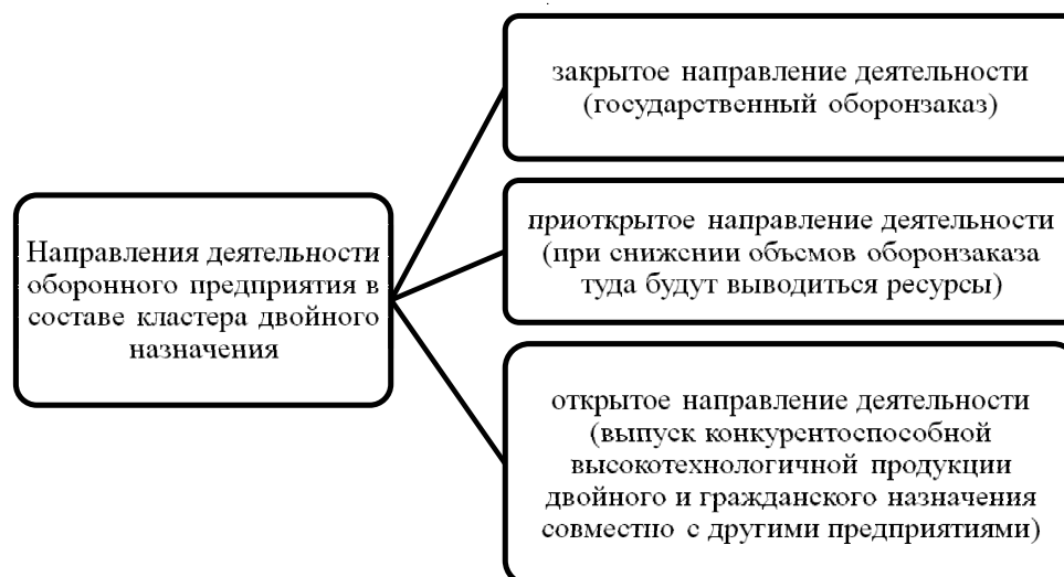
Рис. 2. Направления деятельности оборонного предприятия в составе кластера двойного назначения

Е.А. Антипина, генеральный директор Института государственно-частного планирования, дает наиболее развернутое определение кластерам двойного назначения. Его признаки и отличительные характеристики на основе ее точки зрения представлены на рисунке 1.