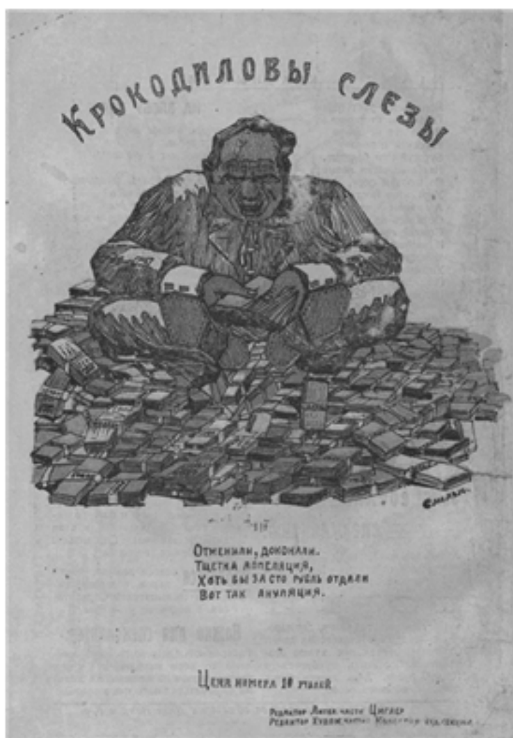
Рис. 3. Карикатура «Крокодиловы слёзы» [14, с. 16]