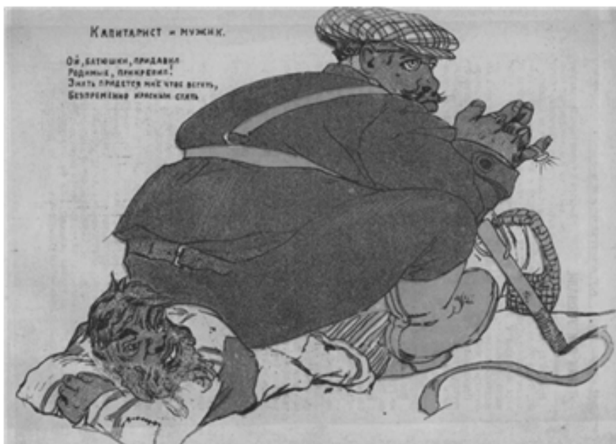
Рис. 2. Карикатура «Капиталист и мужик» [14, с. 12]