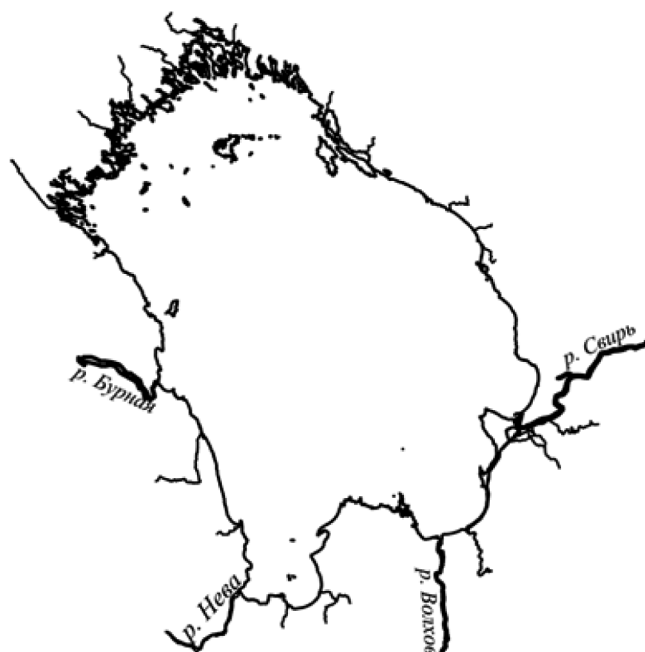
Рис. 1. Расположение точек отбора проб воды на основных притоках Ладожского озера и реки Невы

(конец мая — начало июня), лето (июль — август) и осень (октябрь) 2024 г. Единичные точки отбора проб располагались в нижнем течении рек, как можно ближе к устью, отбор производился с мостов при помощи батометра с поверхности в средней части русла. Схема расположения точек отбора проб на притоках озера представлена на рисунке 1. Обследованы были основные притоки озера реки Бурная, Волхов, Свирь и исток реки Нева.